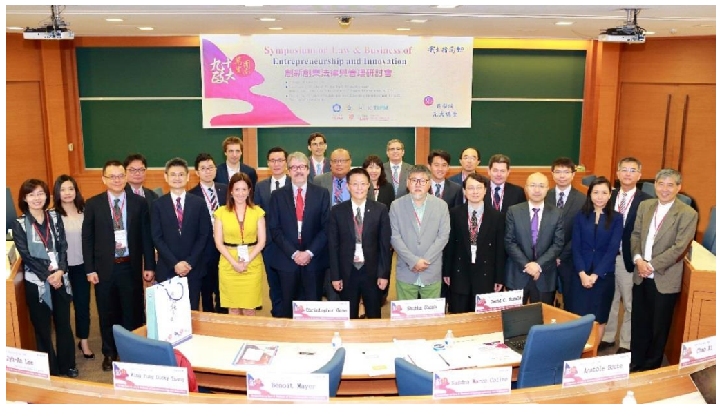
「創新創業法律與管理研討會」與會學者合照。