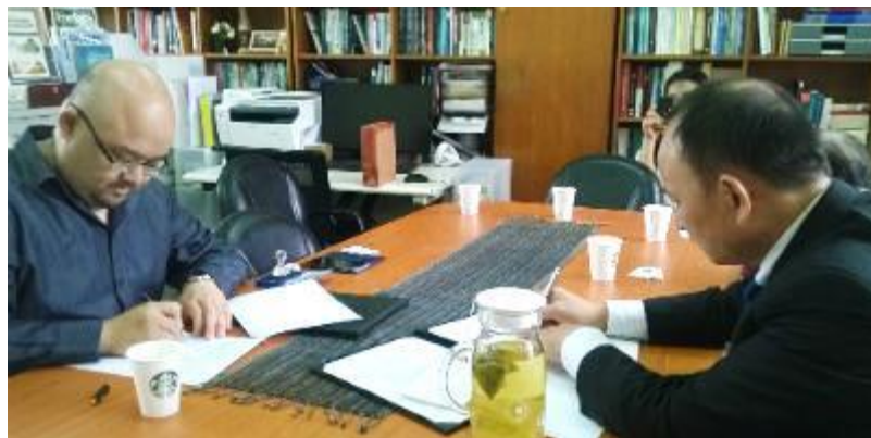
東南亞研究中心再添區域夥伴，與越南社科院東南亞研究所推進合作關係。