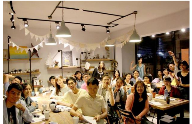
台中場踏實分享會。

創新與創造力中心於4月23至28日，由企管系林月雲教授帶領校內10位學生至韓國蔚山科技大學參加2017 AYEP (Asian Youth Entrepreneurship Program) 亞洲青年創業峰會。本校參與學生來自各個不同科系，有經濟學系、英國語文學系、國際經營與貿易學系、金融學系、教育學系、法律學系、土耳其語文學系等跨系所專長之學生，更顯本校團隊之多元與豐富。