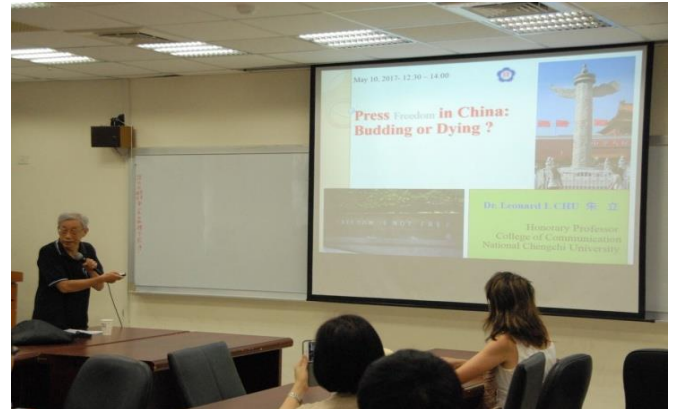
朱立榮譽教授進行傳播沙龍演講活動。