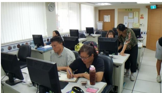
台北市部落大學北原會館。