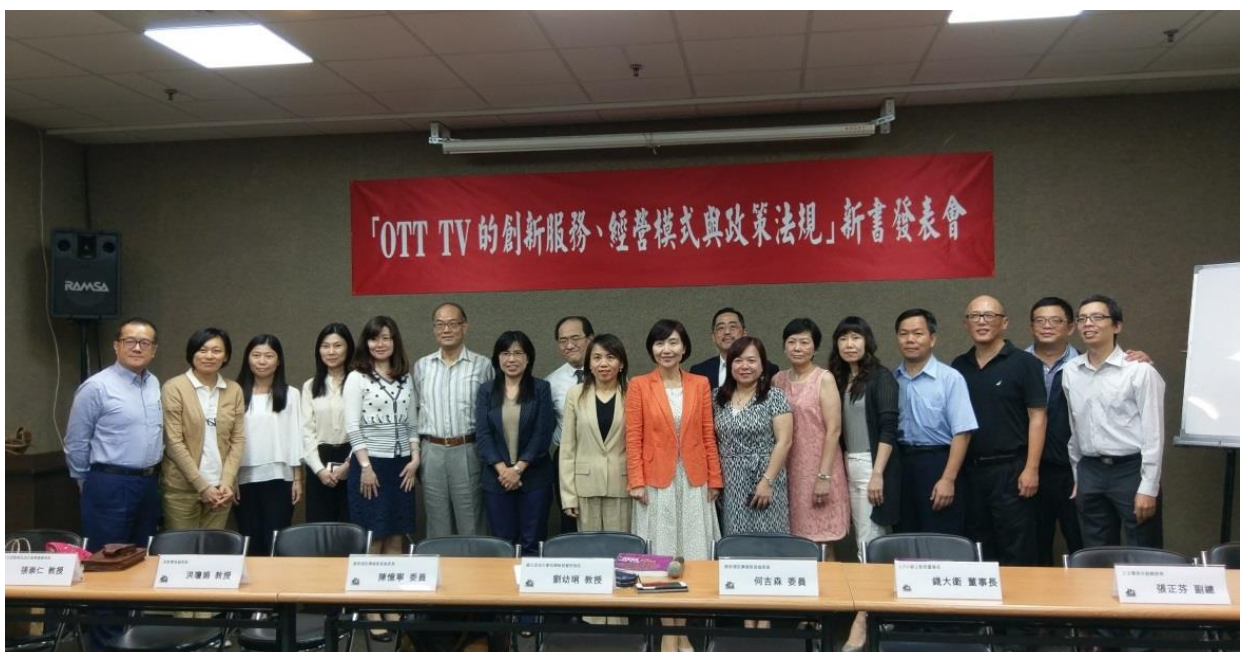
《OTT TV 的創新服務、經營模式與政策法規》新書發表會，促成產官學研對話。

全書從 OTT TV 定義、發展現況，探討國內外 OTT TV 對既有媒體之衝擊影響，聚焦國內外影音使用趨勢，並剖析美國、英國、韓國、日本、中國大陸與臺灣各具特色之市場經營模式及政策法規，以及 OTT TV 監理及境外侵權網站管制等，期待對照國內發展與國際觀察，作為政府擬定 OTT TV 產業政策之借鏡。（摘錄自校訊新聞）