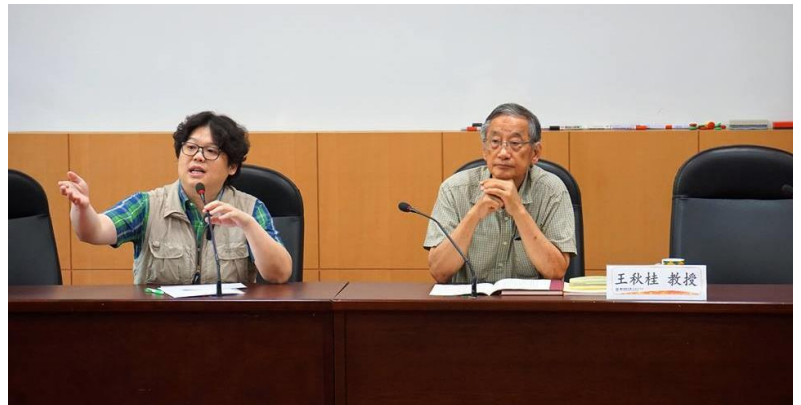
王秋桂榮譽講座（右）主講「歷史與當代地方道教研究」系列講座。

華人宗教研究中心與華人宗教研究中心客座研究員共同籌辦「歷史與當代地方道教研究」系列講座，第二場講座活動邀請清華大學王秋桂榮譽講座教授擔任主講人，以「當代流傳道書的編輯」為題展開討論。