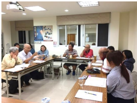
邵語（南投）座談會。