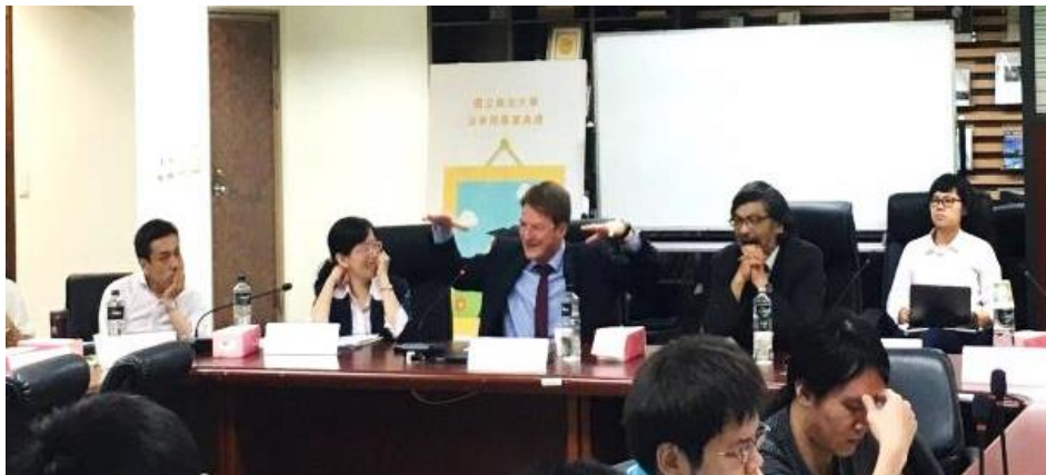
「年金改革與信賴保護研討會」。