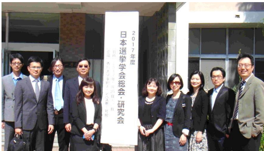
選舉研究中心成員赴日參加2017年日本選舉學會年會。