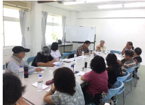
卑南語（臺東）座談會。