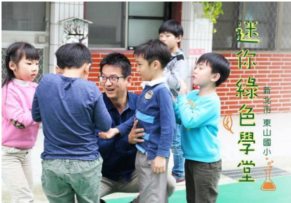
東山國小迷你綠色學堂。