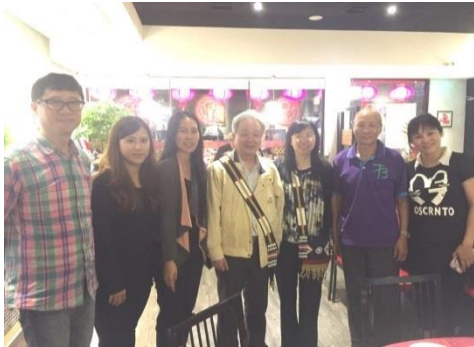
撒奇萊雅語（花蓮）座談會，族人致贈撒奇萊雅族的情人袋。

計畫原定於7月結束，因族人們對於族語復振計畫反應熱絡與積極，「原住民族語言發展法草案」也於5月10日一讀通過，原住民族委員會對於語言復振亦相當關心，因此本計畫預計未來將會延伸發展。