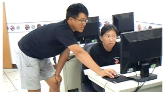
泰雅族的維基小助理引導族人撰寫族語條目。