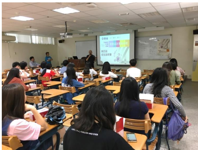
三校「創意設計實務學程」招生說明會。

https://zh-tw.facebook.com/ThreeForOneCourse