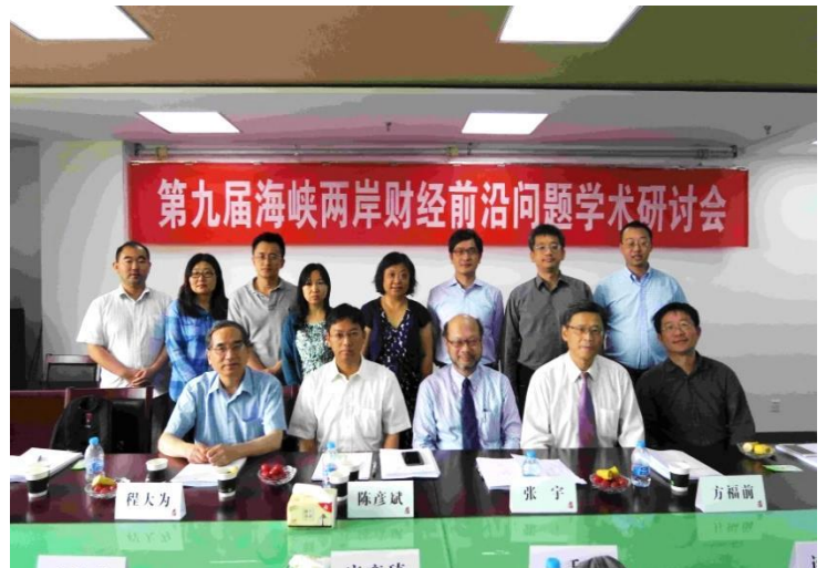
「第九屆海峽兩岸財經前沿問題學術研討會」與會學者合影。