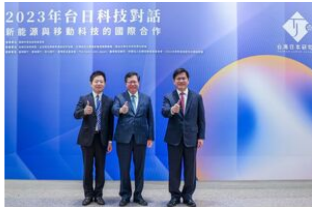
行政院鄭文燦副院長(中)、總統府林佳龍秘書長(右)蒞臨會場合影留念

行政院副院長鄭文燦在開幕致詞時強調，未來臺日雙方會持續在半導體、新能源、5G、電動車等領域進行合作；更期待臺日在氫能上的合作，能夠符合雙方淨零碳排的進程，深化既有的科技產業合作。前行政院副院長，目前擔任臺灣金控董事長的沈榮津表示，替代燃油的能源轉型要公平公正地持續推動；而包括半導體在內的臺日合作，則是一種互補的共生共榮關係。日本台灣交流協會泉裕泰代表期待，面對能源與氣候變遷課題，可透過本次的科技對話開展臺日共同解決課題的道路。總統府秘書長林佳龍強調，中國霸權的崛起已成為主要國家的課題，樂見臺日科技合作有所突破。