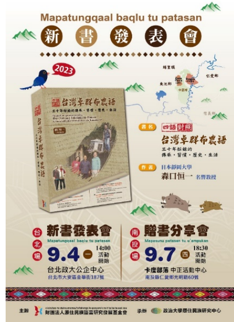
▶ 《台灣卓群布農語：三十年採錄的傳承·習慣·歷史·生活》新書發表會海報

9月4日在國立政治大學公企中心舉辦新書發表會並開放線上直播觀看。書中除了有語言學導論外，在語料正文中收錄了卓群布農語、日本語、英語、華語等四語對照的9章故事及1章歌謠，總計131則故事1,689句，語彙收錄2,450詞，並於書末提供布農語語彙表，這是一部對族語教學、語言分析、文化研究都有跨時代價值的語料採錄專書，勢必將成為研究、學習卓群布農語不可或缺的珍貴資料。