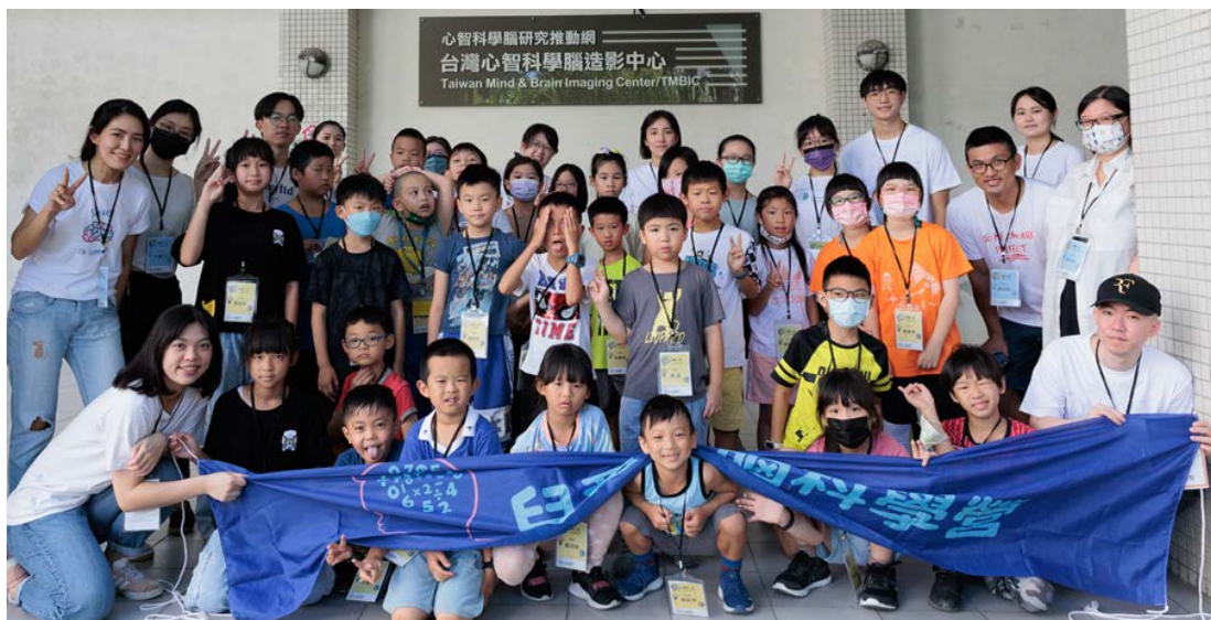
▶「腦動一夏兒童大腦科學營」大合照

●【心智、大腦與學習研究中心訊】心智、大腦與學習研究中心於7月8日舉辦「腦動一夏兒童大腦科學營」，此活動如往年受到各界矚目，報名踴躍，公告一推出當日即迅速額滿。活動當天孩子們在大腦健身操、腦區的認識與探索、手做神經元和大腦帽、探險磁振造影實驗室、機智腦搶答中都熱烈參與，透過此營隊培養兒童對大腦功能的瞭解以及科學研究的興趣。