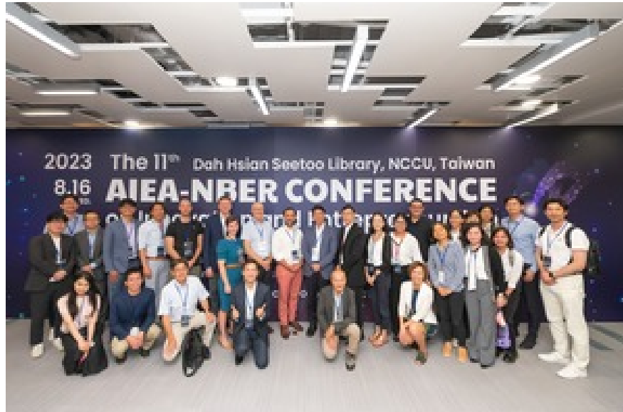
▶ 第 11 屆 AIEA-NBER 國際研討會專家學者大合照

或企業產生正面影響，並提供產官學界一條更加清晰的未來發展路徑。(摘錄自校訊新聞)