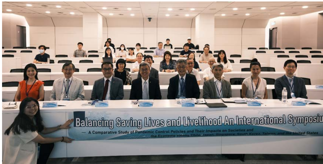
▶「平衡挽救生命與維護生計國際研討會」與會貴賓