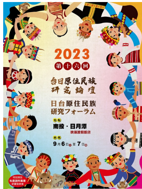
▶ 「台日原住民族研究論壇」海報

今(112)年為疫情解封後臺日雙方首度實體開會，於9月6日至7日於南投日月潭映涵飯店辦理會議，會議共有4場論文發表，分別為「透過與資料的對話解讀臺灣原住民族之近現代」、「南投縣台灣原住民族的歷史發展」、「台灣原住民族的語言研究」及「台灣原住民族與愛努族的社會變遷」，共發表13篇原住民族研究相關論文，精彩可期。