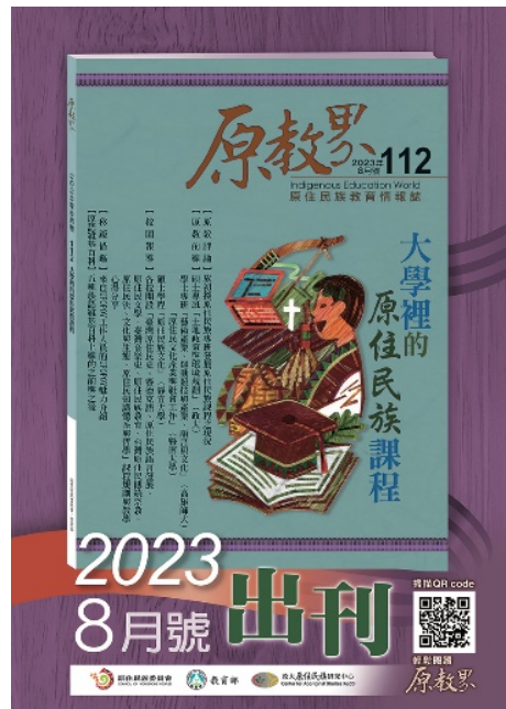
▶《原教界》112 期

•【原住民族研究中心訊】《原教界》112 期出刊！主題為「大學裡的原住民族課程」。近年來原住民族從小學到高中，逐漸發展出具有民族文化特色的課程，讓原住民孩子在學習過程中能對自身文化更有自信。而進入高等教育後，各大學普設原住民專班，除了原科系的專業課程訓練外，特別強調需學習原住民族的文化課程。112 期探討的就是在大學所開設的原住民族課程對於其文化發展的影響。除了從政策面、學者的角度以及現場教學歷程去談論課程外，也刊載 4 個學校所開設的專班特色，分別為國立政治大學、國立高雄師範大學、國立暨南國際大學以及靜宜大學，並分享在不同領域中與原住民族相關課程的設計與教學情形，讓讀者能從文章中認識大學裡的原住民族課程。