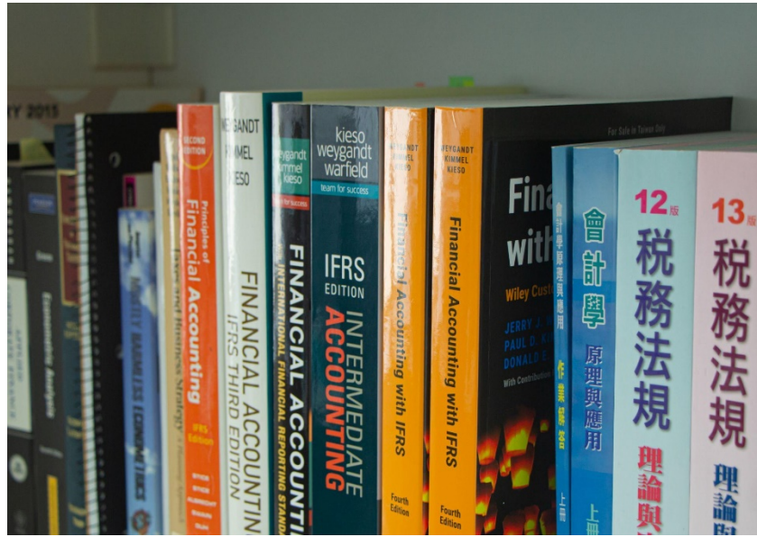
▶ 翁嘉祥的研究室中陳列著琳瑯滿目的會計相關書籍

近年來，翁嘉祥的主要研究領域與企業永續、社會責任等主題相關，其實當時踏入相關領域的研究之路，也帶著些機緣巧合。他分享，大約五、六年前發現國際研討會中開始頻繁出現與 ESG (環境保護、社會責任、公司治理)、氣候風險相關討論，顯示出學術界與企業界都逐漸