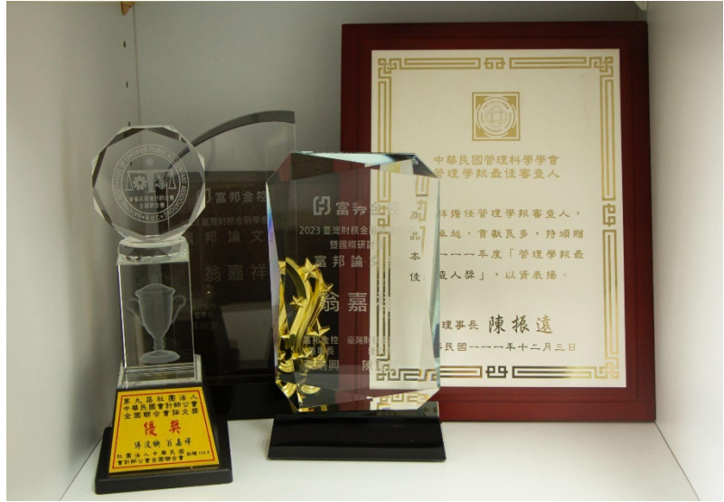
► 研究室中擺滿翁嘉祥所榮獲的論文獎項

優秀年輕學者計畫的補助，無疑是對學術界資歷尚不算深的翁嘉祥研究能力方面的認可。他也呼籲年輕學者們，在這個世代，做研究時也需培養多方面的程式及資訊能力，「包含文字探勘、機器學習等等，都可能在未來做研究時會派上用場。」他也提到，自己平時做研究也會找資訊科學系的學生擔任助理，顯示程式能力在現今的學術場域中，確實扮演重要角色。