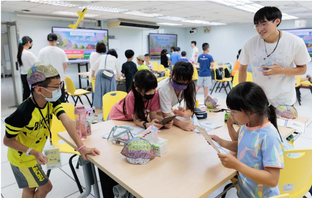
▶活動當天孩子們在手做神經元和大腦帽