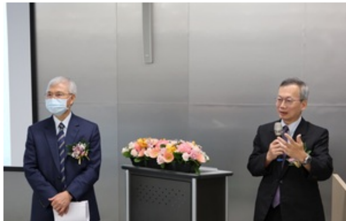
▸ 李蔡彥校長 ( 右一 ) 與中央銀行楊金龍總裁 ( 右二 ) 合影