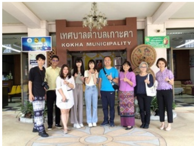
▶ 閣卡鎮政府(เทศบาลตำบลเกาะคา)綜合行政部門實習介紹

區以手工藝紡織品和溫泉為名，訪客能到社區學習用在地植物做染料以織布編織，看見社區產業發展的永續模式。當晚，泰國國立法政大學為到訪的國立政治大學師生舉辦歡迎晚宴，為實習揭開序章。