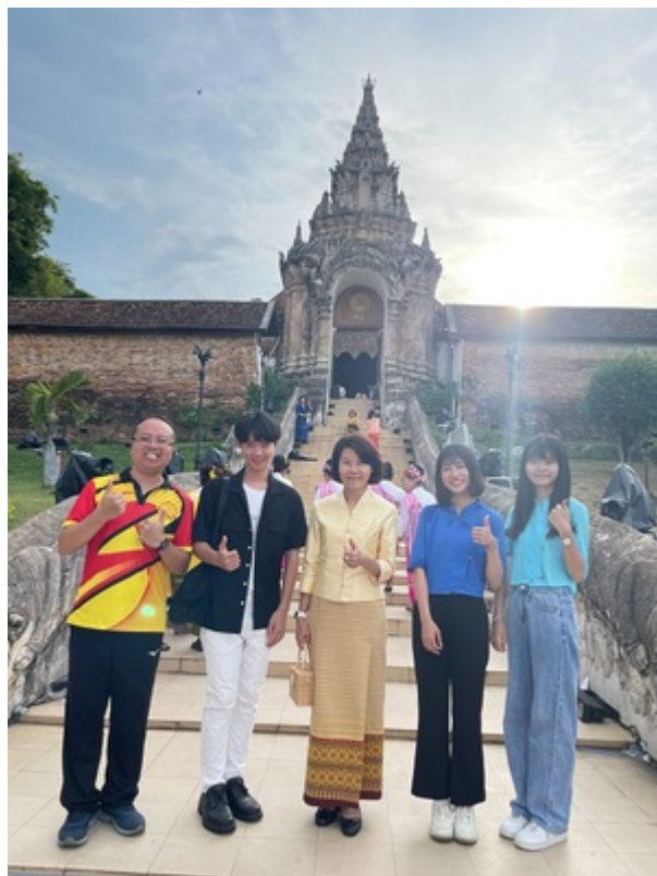
▶ 國立政治大學學生參與南邦鑾寺節慶活動

實習尾聲時，鎮政府行政部門攜家帶著與國立政治大學學生前往杰松國家公園 (อุทยานแห่งชาติแจ้ซ้อน) ，行政同仁各自帶一些佳餚前往，與鎮政府同仁們野餐交流，感受一家人的溫暖。在閣卡鎮村子實習的最後一夜，鎮政府歡送即將調職的同事和國立政治大學實習生，向鎮長致送感謝狀與卡片，一起在鎮政府會議室相聚並且互道珍重，畫下圓滿的閣卡鎮政府的實習之旅。(摘錄自校訊新聞)