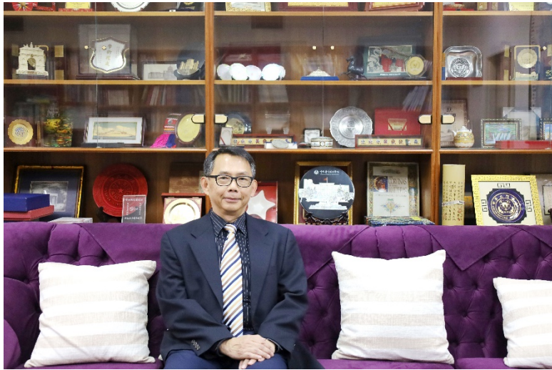
► 國際關係研究中心主任辦公室的落地櫃中，整齊陳列著交流單位贈送的紀念品

2004 年，因應校園政策，加上冀望與更多政治學者交流，寇健文轉任社會科學學院政治學系，而在升等教授之後，又因緣際會擔任國際事務學院東亞研究所的所長職務。他表示「東亞研究所在臺灣的中國研究裡，是一個極為重要的學術單位。」也因此，在任職所長的六年期間，寇健文專注所內各項發展與師資人力，為系所奠定深厚的基礎。卸任東亞研究所職務後，他以主任身分再次回歸國際關係研究中心，並在今年三月舉辦國際關係研究中心 70 週年特展，彙整歷年珍貴且意義深遠的史料與檔案，公開陳列展覽。