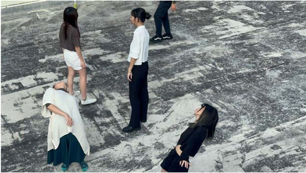
▶ 學生在社資中心前跳舞

「X計畫」在十月的三週間，都是給同學分組發展計畫的自由時間。在十月的最後一天，學生回到教室，帶來了報告、朗誦、表演等各式展演。