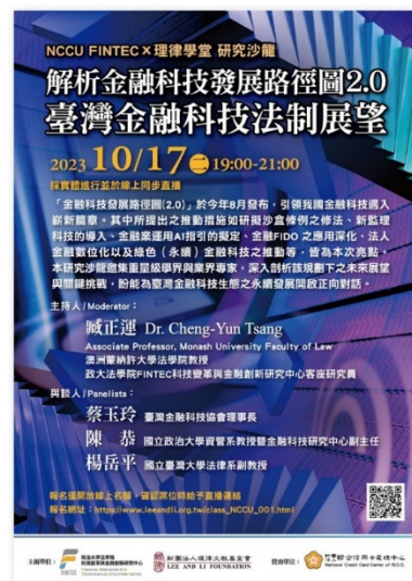
▶ 活動海報

• 【法學院訊】「金融科技發展路徑圖(2.0)」於今(112)年8月發布，引領我國金融科技邁入嶄新篇章。本研究沙龍由法學院科技變革與金融創新研究中心與財團法人理律文教基金會於10月17日舉辦，邀集重量級學界及業界專家，深入剖析該規劃下之未來展望與關鍵挑戰，盼能為臺灣金融科技生態之永續發展開啟正向對話。由澳洲蒙納許大學法學院臧正運教授主持，台灣金融科技協會蔡玉玲理事長、國立政治大學資訊管理學系教授暨金融科技研究中心陳恭副主任及國立臺灣大學法律學系楊岳平副教授主持。