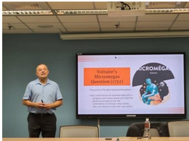
▶ 國立清華大學台北政經學院客座教授 Yves Tiberghien

Yves Tiberghien 教授提到，當代全球環境不同於以往，除經濟上不確定性，更有層出不窮的中小型軍事衝突，以及南方國家崛起下的多中心發展趨勢，近年的人工智慧變革、氣候變遷也凸顯當代社會議題之窘迫。對諸國來說，面對社會變局及後霸權時代的來臨，使得全球秩序處於爭奪之中，往往需要在單邊、多邊的國際關係中，發展出各異策略，而此種情形也弱化了整體國際社會的合作與協調，各類型高峰會的產生便是奠基於既存國際情勢。以 112 年度為例便有 G7 (七大工業國組織)、BRICS Summit (金磚國家峰會)、EAS (東亞峰會)、G20 (二十大工業國組織)、UNGA (聯合國大會) 等。