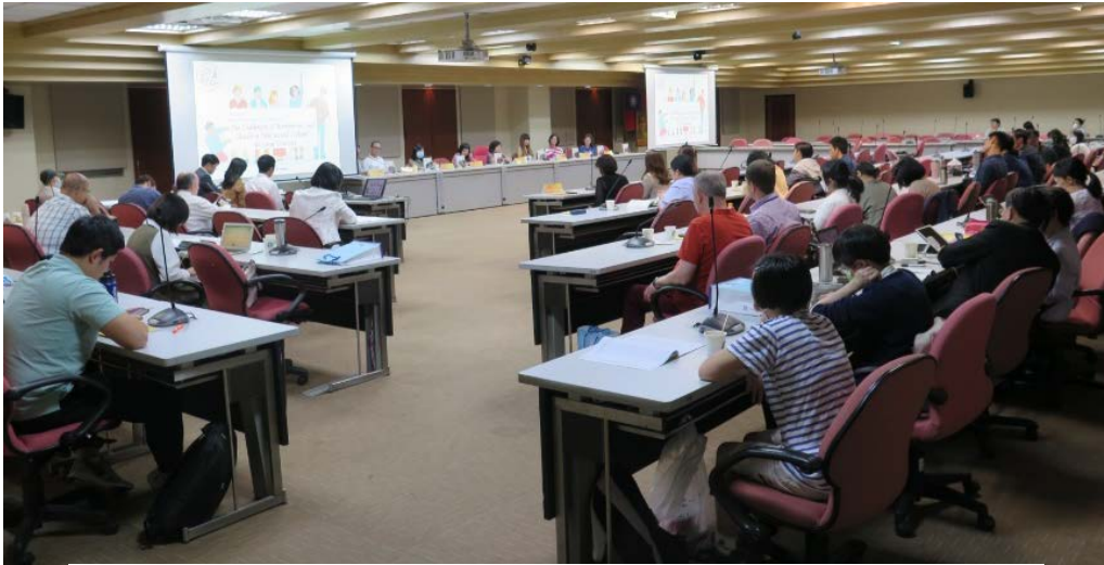
▶ 「第二文化之延伸」工作坊