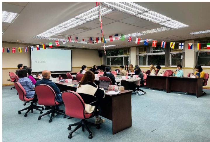
▶ 外國語文學院中外籍教師熱烈參與

●【斯拉夫語言學系訊】第四屆「捷克日在政大」(Czech Day @ NCCU) 於 10 月 31 日在國立政治大學舉行。該活動由捷克經濟文化辦事處與斯拉夫語文學系於 2020 年 11 月首次舉辦，旨在增進國立政治大學師生對捷克文化的認識，並進一步鼓勵捷克語文學習。