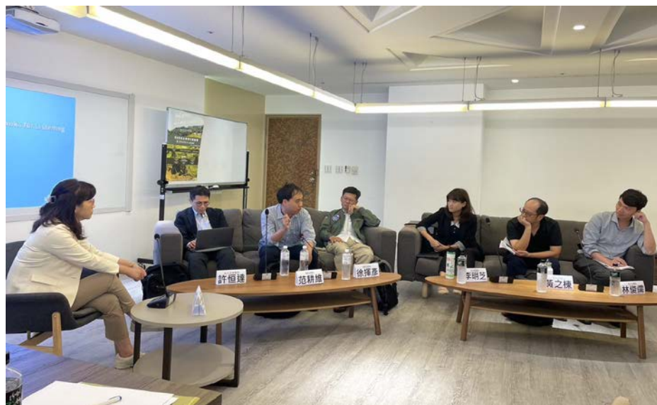
▶ 講者們分別就此次的會議主題討論可再深入思索的面向

論壇在師生討論間劃下句點，相信日後原住民法律與社會議題的種子，在與會者的心中發芽，唯有持續地關注，不斷地反思，深入地思考，才能為每一個可能存在主流社會之外的主體，尋覓更為適切的生存位置，致使多元文化的保護成為可能。