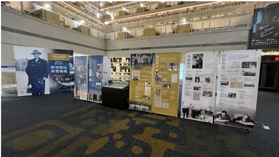
▶ 「密勿壇站·參贊樞機：沈昌煥先生特展」展覽現場

特展在原館展出至 11 月 3 日，設置十個主題，展出沈昌煥先生的生平紀要，附以關鍵事件的史料與照片，呈現其壇站周旋、老成謀國的一生寫照。展區展示沈氏寫給家人的親筆家書與任職期間的公務文件，可領略其於公私領域的不同人格特質。