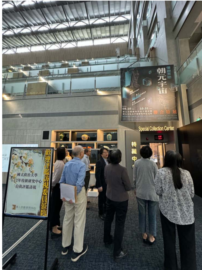
▶ 華人宗教研究中心訪視評鑑活動