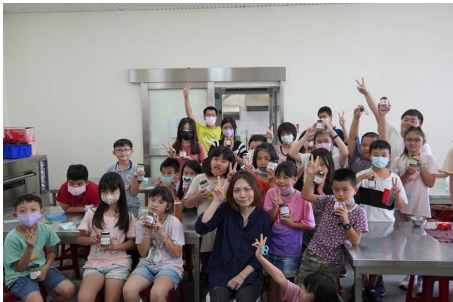
▶ 志工老師帶著故事與啟發的種子走進石角國小，把水果製作為果醬，把空白的標籤貼紙畫上品牌圖樣，大人與孩子們一起，以水果相甜，以心意相伴