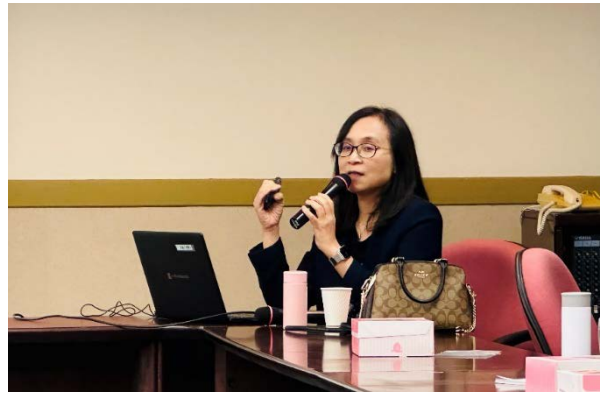
▶ 語言學研究所黃瓊之教授經驗分享