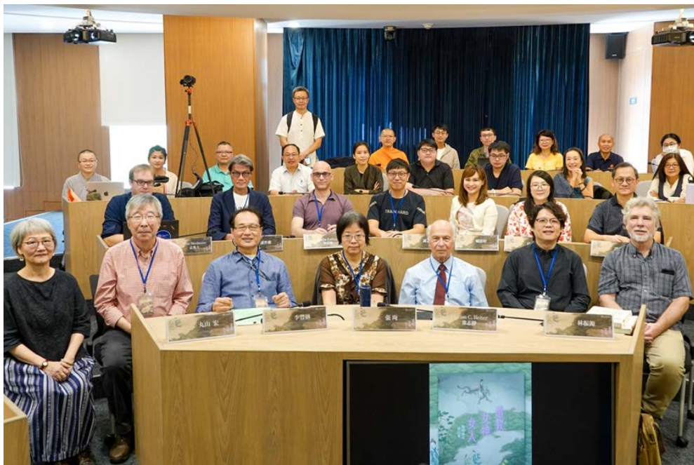
▶ 「道教、女神與女人」國際學術研討會大合照