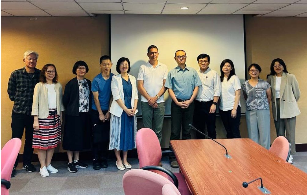
▶ 德國柏林洪堡大學人文社會學院副院長韓可龍教授（左六）、外國語文學院鄭家瑜院長（左五）、文學院金仕起副院長（左一）、歐洲語文學系姚紹基副教授（右五）及與會師長合影

最後 Q&A 時間，現場聽眾踴躍發言提問請益，韓可龍教授一一解說，與會師生可說是滿載而歸，講座活動在掌聲中圓滿落幕。