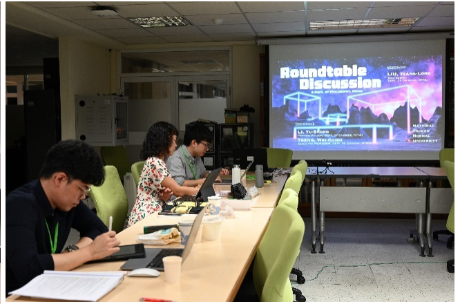
▶ 「跨東亞傳統實踐哲學國際會議」會議照片