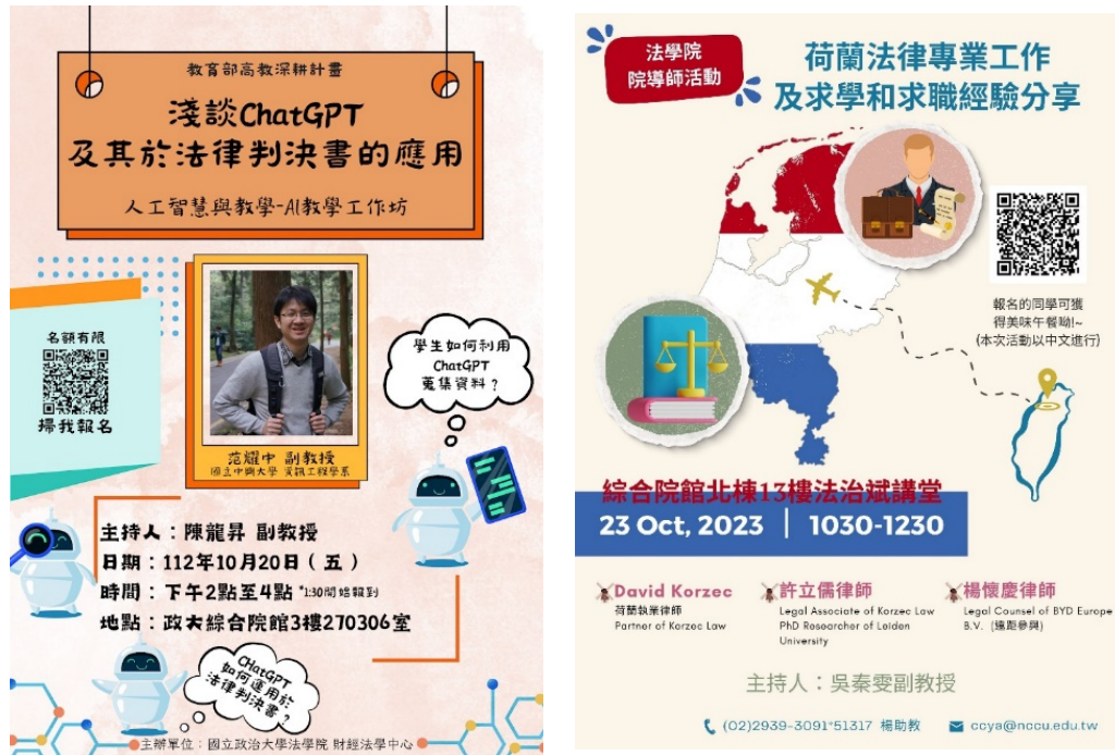
▶ 活動海報