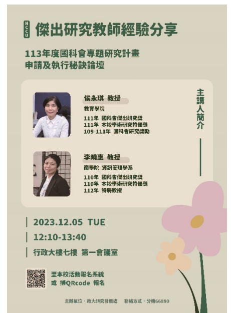
▶ 活動海報