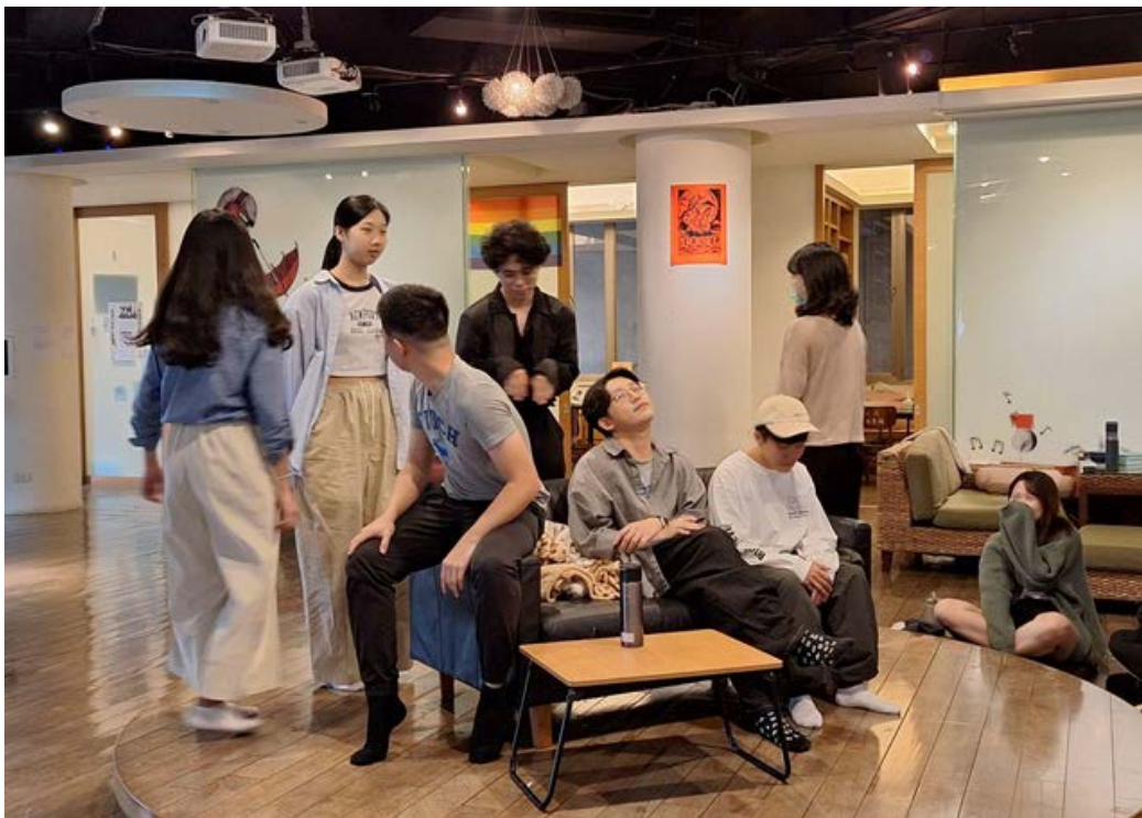
▶ 學生邀請眾人上臺參與表演