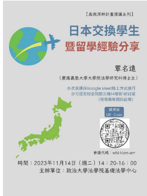
▶ 活動海報