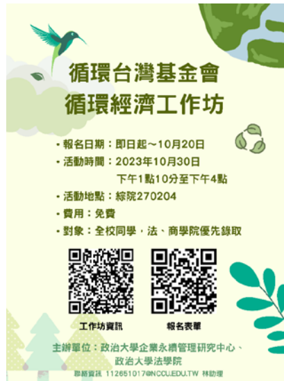
▶ 活動海報