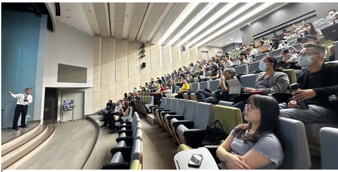
▶ 「科學新知：腦與心智功能的評估與促進」講座現場活動