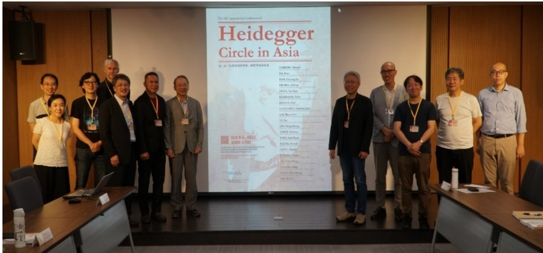
▶ 「第三屆亞洲海德格學圈」國際學術研討會，與會學者來賓合照

•【哲學系訊】哲學系於 10 月 4 日至 6 日三天舉辦「第三屆亞洲海德格學圈」國際學術研討會，此次會議共有 19 篇研究論文發表，參與學者來自臺灣、韓國、日本、菲律賓、中國、伊朗等。會議中發表之論文主題廣泛，涵蓋對海德格早期及晚期思想之詮釋與再詮釋，探討海德格哲學之現代意涵及應用，以及東方思想與海德格思想之比較研究與對話等，會中討論熱烈；透過此次研討會的舉辦，不僅鞏固學術對話平臺，以持續推進亞洲海德格學者間的思想交流，且形塑了能長期友善合作的跨文化暨跨國際之學術社群文化，同時提高臺灣海德格學者及其學術成果之能見度，可謂非常成功的一次國際研討會，並已在會後積極籌備論文集的出版事宜，將此次學術研究成果集結成冊。