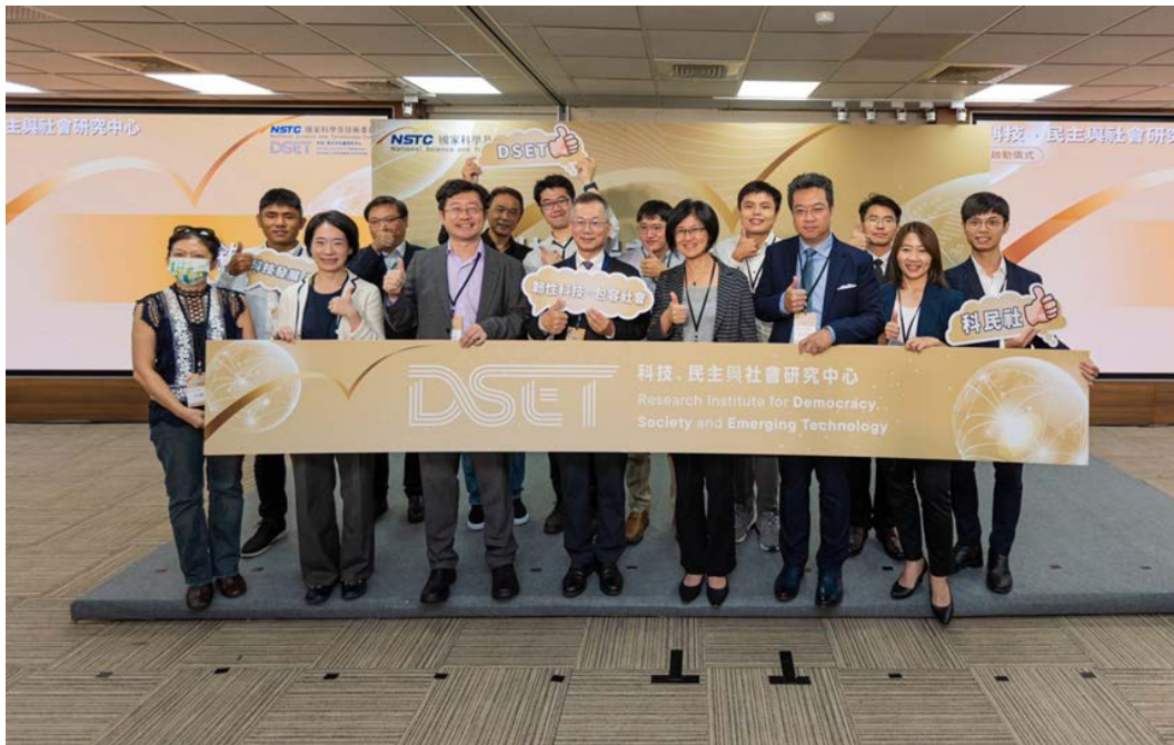
▶ 科技、民主與社會研究中心正式啟動，展現科技與社會新連動，活動大合照