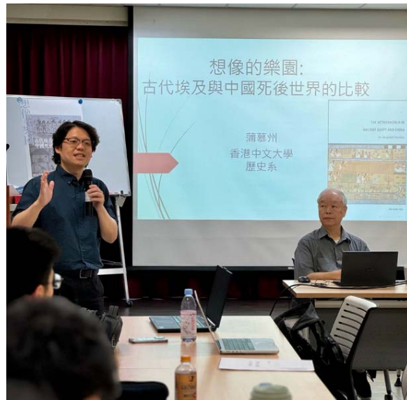
▶「想像的樂園 - 古代埃及與中國死後世界的比較」專題演講