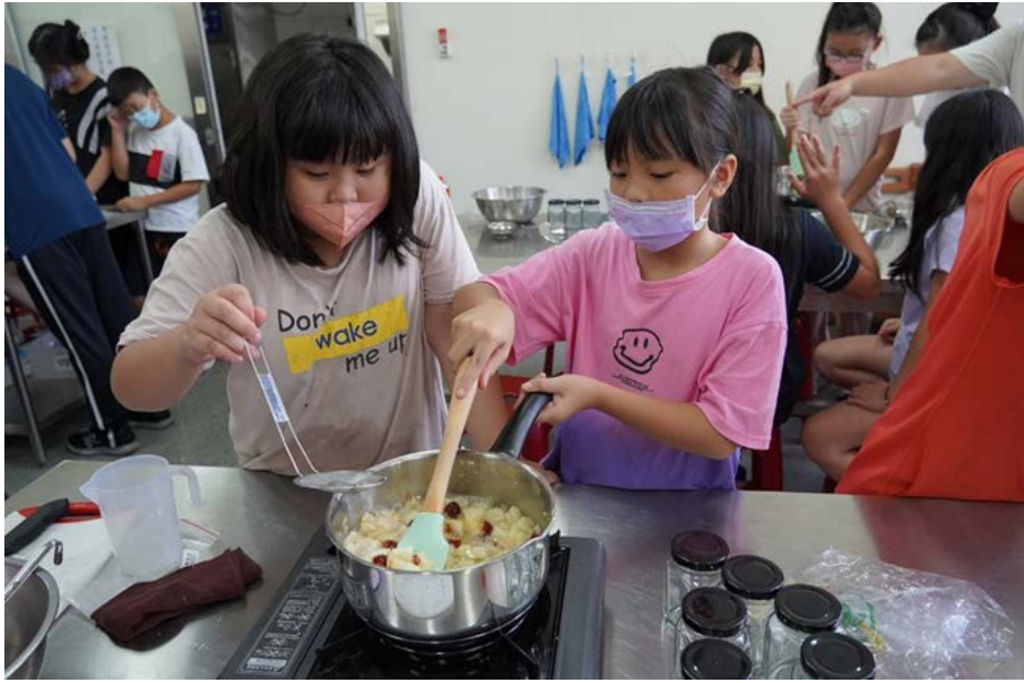
▶ 把水梨和冰糖倒在一起，開火、加熱！當冰糖融化、水梨緩緩出水，就是加入檸檬汁、川貝碎、紅棗的時間，接著，進入一段耐心大考驗