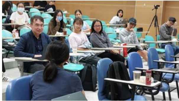
▶ 講座綜合座談階段，講者與聽眾積極分享討論，氣氛熱烈。

是否能讓人幸福感增加。基因與環境存在交互作用，基因易受到環境因子觸發而反應，且穩定環境會增強基因影響力，個體對環境敏感度更因基因有所不同。研究發現，基因與社經地位均會影響伴侶關係軌跡，而軌跡亦能調解基因傾向之影響，例如同樣福祉基因分數，穩定的伴侶關係能顯著幫助其獲得快樂，支持累積優勢、劣勢框架及社會補償的假設。而生育方面則發現，雖然難以解釋生育數對健康的顯著影響，但可佐證教育程度低會加重基因的不良影響，教育程度高則能保護基因弱勢群體，不過對於本身已有基因優勢則無法保證有更好的老年健康。這點出環境因素之重要性、基因效果之可塑性，及改善教育環境有助於緩解個人基因劣勢。