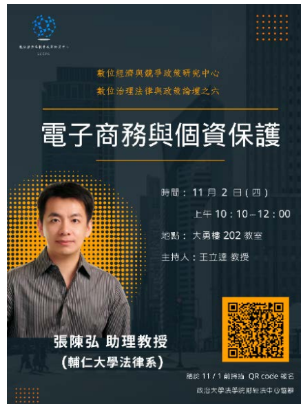
▶ 活動海報