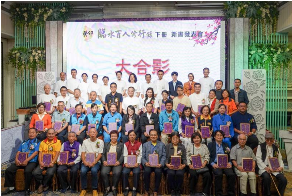
▶2023《臨水百人修行錄》(下冊)新書發表會大合照