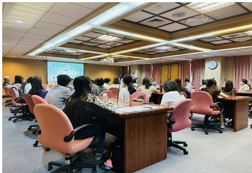
▶ 講座活動座無虛席