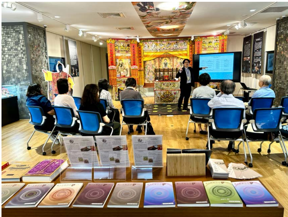
▶ 華人宗教研究中心訪視評鑑活動