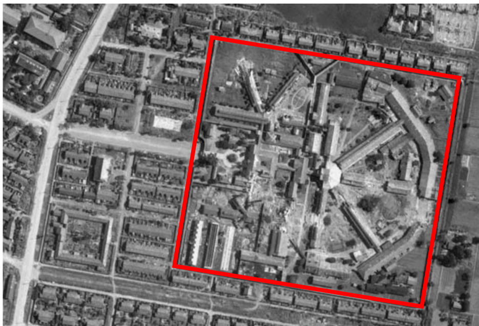
1945年美軍航照顯示的台北刑務所及附屬木造建築