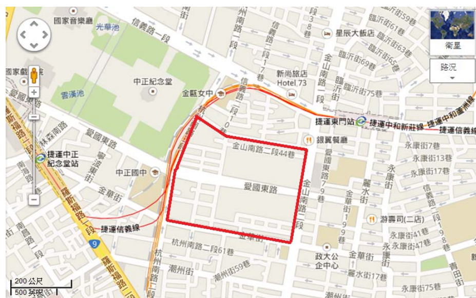
(現況周邊道路對應圖)