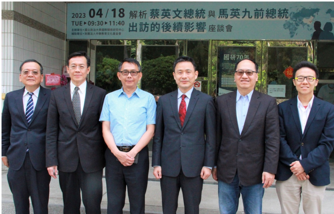
▶ 「解析蔡英文總統與馬英九前總統出訪的後續影響」座談會

•【國際關係研究中心訊】國立政治大學國際關係研究中心於4月18日上午舉辦「解析蔡英文總統與馬英九前總統出訪的後續影響」座談會，邀請專家學者對兩人出訪可能對臺灣外交、軍事、選舉、兩岸、國際法的影響與後續效應，進行深入剖析。此場座談會邀請到國立政治大學國際關係研究中心劉復國研究員、國防大學中共軍事事務研究所馬振坤教授、國立政治大學選舉研究中心特聘研究員、政治學系合聘教授陳陸輝主任、國立政治大學國際關係研究中心陳德昇研究員、國立臺灣大學政治系蔡季廷副教授擔任與談人，就各層面進行深入探討。