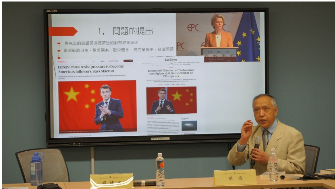
▶張倫主講「從近期的馬克宏談話，馮德萊恩對華政策說明，看當下的歐中關係及可能的走向——兼談歐洲對台政策」