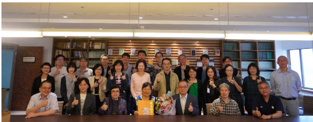
▶ 榮退儀式禮成合影