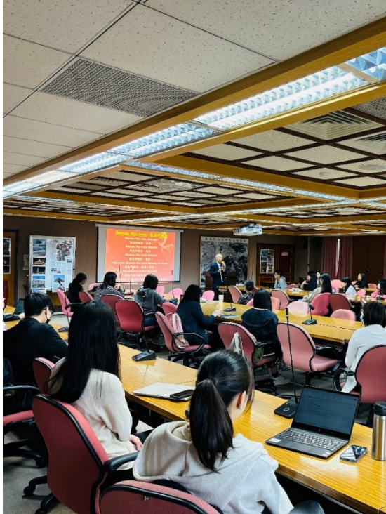
▶前駐法國特任大使呂慶龍精彩且豐富的演講內容，與會師生得以一窺外交事務之堂奧

講座尾聲呂慶龍勉勵在座同學努力充實，嘗試並挖掘自己的潛力，才能為未來創造更多機會。精彩且豐富的演講內容，令在座師生得以一窺外交事務之堂奧，收穫滿滿；講座結束後意猶未盡，紛紛私下提問請益，大家可說是滿載而歸。