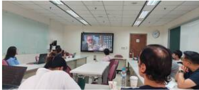
▶講者 Glenn Denning 教授與聽眾分享年初發表新書

•【國家發展研究所訊】國家發展研究所長期致力投入發展研究與全球治理的教研目標，積極落實與實務接軌，於 2019 年 5 月與國際合作發展基金會（簡稱 ICDF）簽署合作交流協議以來，雙方即展開長期性的深入合作，在多年基礎上，共同規劃於 4 月 19 日邀請全球糧食安全領域著名學者、美國哥倫比亞大學國際暨公共事務發展實務研究所（MPA-DP）教授 Glenn Denning，以遠距同步會議形式，分享多年來於糧食安全議題中之研究成果。