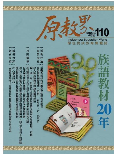
▶ 110 期《原教界》主題為「族語教材 20 年」

●【原住民族研究中心訊】《原教界》110 期出刊！主題為「族語教材 20 年」。教育部與行政院原住民族委員會於 2002 年委託原住民族研究中心編纂第一套現代化的族語教材，於 2006 年完成九階教材編印，2010 年又受行政院原住民族委員會委託編纂四套族語補充教材。為因應十二年國教，2020-2022 年教育部國民及學前教育署持續委託國立政治大學編纂 10-12 階教材。110 期回顧族語教材推行 20 年以來所面臨的問題與挑戰，透過當時參與編輯的人員來共同回憶工作的甘苦與心路歷程，並邀集族語老師從自身的經驗來探討族語教學的現況與困境，進而分析族語認證的推動挑戰。各篇文章皆有助於讀者了解族語教材的發展歷程與前瞻趨勢，同時紀念這 20 年來陸續參與這項偉大語言工程的六百多位編輯人員，具有重大意義。