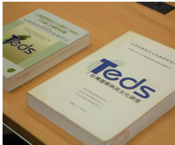
▶ 「台灣選舉與民主化調查」(TEDS) 為陳陸輝自 2008 年開始參與的大型民意調查研究計畫

TEDS 的主要工作內容為執行國內的各種選舉民調，陳陸輝也分享過去幾年隨著時代變遷，該計畫在樣本選擇上的變化。原先的樣本來源主要以面訪及電訪為主，前幾年團隊曾考慮是否該順應網路世代，將網路調查納入調查方式的一種，不過經嘗試後，他們也發現：「網路調查得到的樣本，大致就是比較年輕，教育程度比較高，然後居住在都會區的人們，跟我們母群體的分布不太一樣。」過度集中於同一類型的族群，讓我們對於要不要以網路調查結果推論到選民母群體上有所保留。此外，團隊近年來也注意到「唯手機族」(意為只能以手機號碼聯繫，而無法透過市話找到的族群)有增加趨勢，因此目前在 TEDS 的電訪中，會適當調整手機及市話抽樣比例，試圖找出最接近臺灣現況的樣本分佈型態。