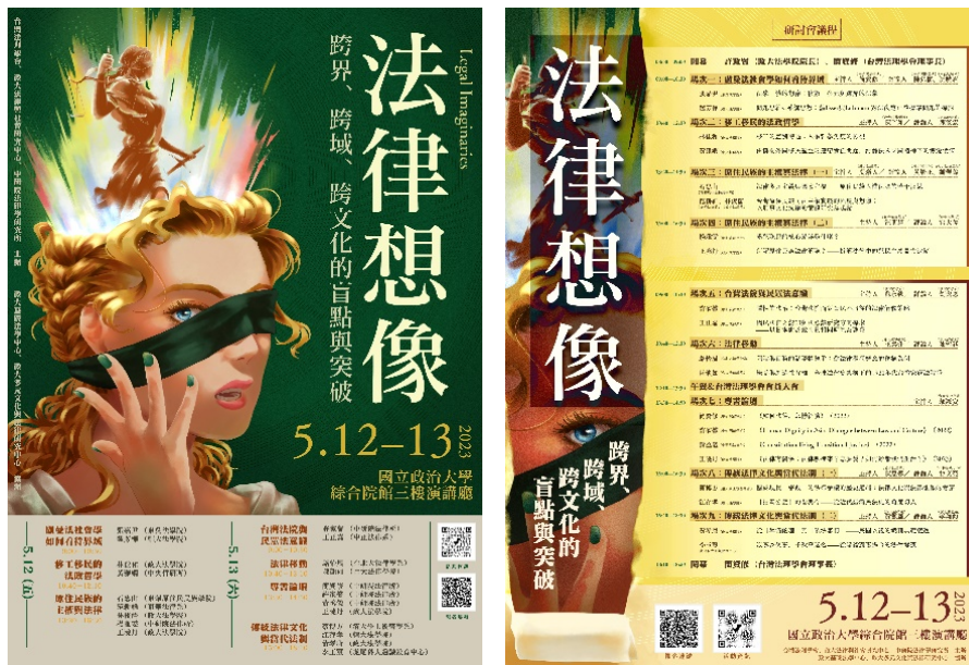
▶活動海報

5月12日上午場次為「盧曼法社會學如何看待界域」、「移工移民的法政哲學」二場場次，下午主題為「原住民族的主權與法律」，分為兩場次舉行。而5月13日上午場次為「台灣法院與民眾法意識」及「法律移動」，下午則有一場專書論壇，及主題「傳統法律文化與當代法制」，分為兩場次舉行。