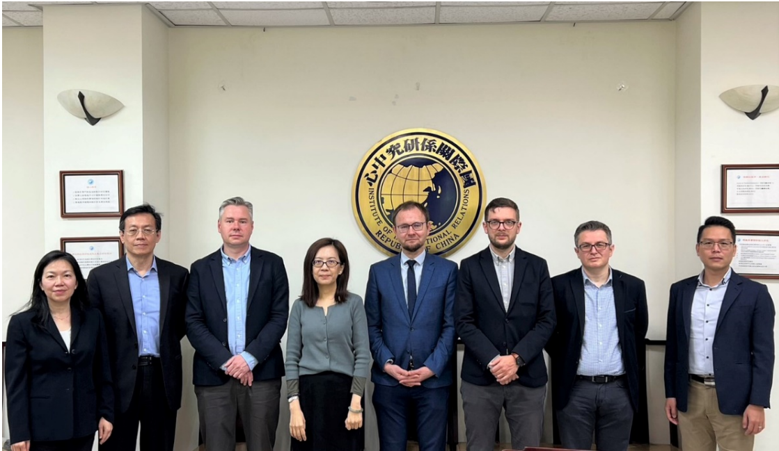
▶波蘭智庫波蘭東方研究所訪問大合照