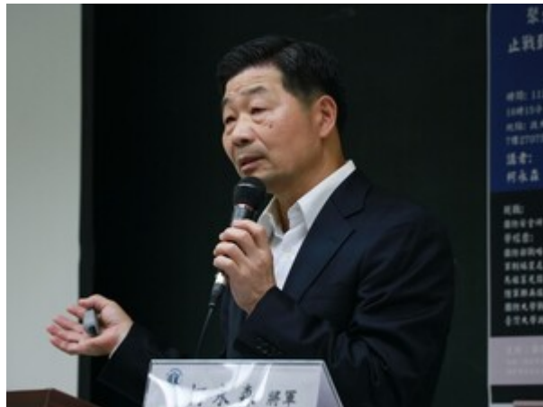
▶國防安全研究院特約研究員、柯永森備役少將以實務經驗與淵博學識為同學帶來精彩的演講

因應近期情勢，國際事務學院特別邀請到曾經擔任國防部戰規司軍事編裝處處長，現任國防安全研究院特約研究員的柯永森備役少將，以豐富的實務及學識經驗，發表對臺海局勢、國內軍力運作、國軍戰略計畫的分析與見解。