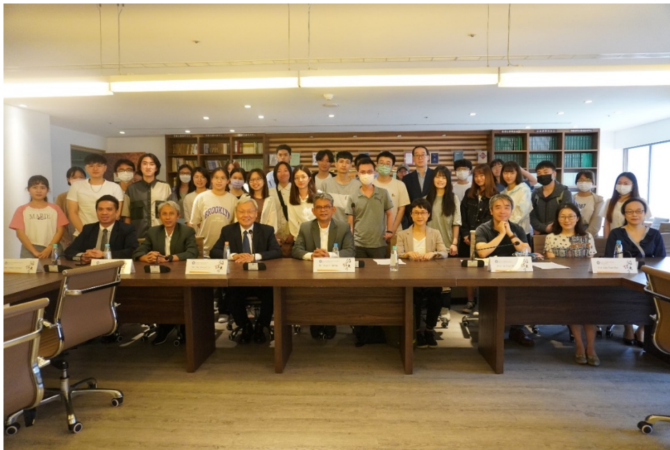
▶講座會後大合照