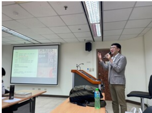
▶主講人、日本法政大學法學部國際政治學科熊倉潤教授。

●【東亞研究所訊】東亞研究所於5月3日與俄羅斯研究所共同邀請日本法政大學法學部國際政治學科熊倉潤教授，以「《新疆：被中共支配的七十年》：要點與特色」為題進行專題演講。由東亞研究所鍾延麟教授兼所長主持。與會學者有：俄羅斯研究所魏百谷所長、東亞研究所王信賢特聘教授、黃瓊菽教授、薛健吾副教授。日本東京大學東洋文化研究所松田康博教授也出席聆聽。