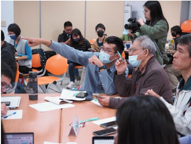
▶ 參與者十分投入講座內容·彼此交流討論