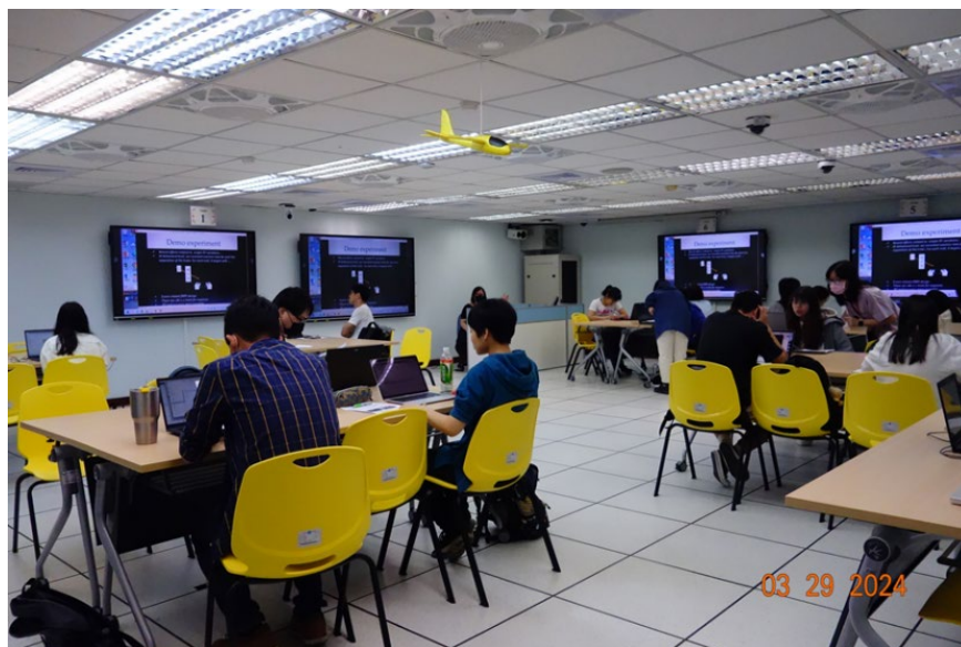
▶ 「fMRI 資料分析工作坊」活動照片