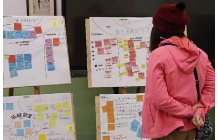
▶ 透過審議式討論設計及實作·收斂意見並圖像化