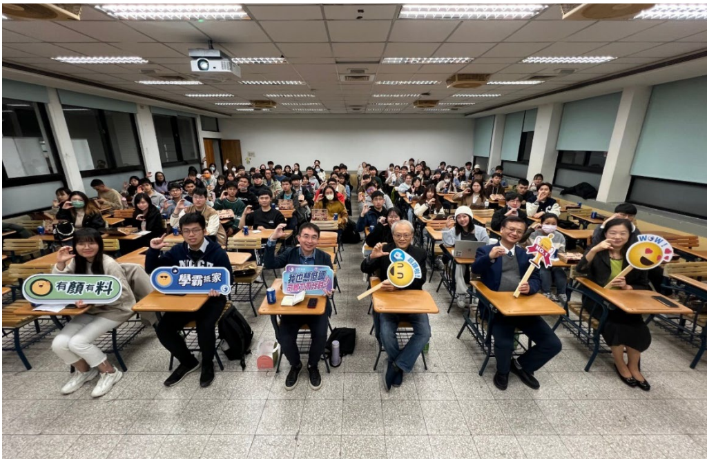
▶ 資訊學院邀請中華電信共同舉辦企業日活動，全體合影

資訊學院自成立以來陸續與中華電信、普鴻科技、財金資訊等公司簽訂產學合作備忘錄，不但展開學術與產業間的研究合作，也透過業師授課、企業實習等模式，期在提供學生學術知識外，更多切合產業面實務學習機會，藉以打造學用合一、產學接軌的優質人才培育環境。