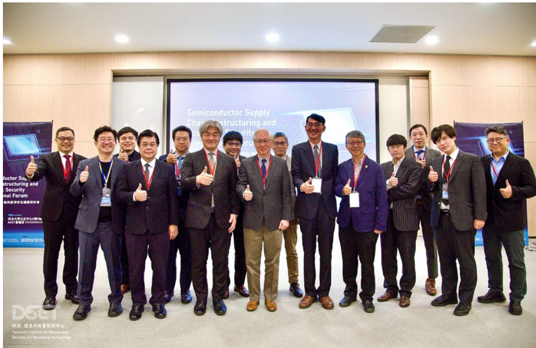
▶ 國家科學及技術委員會吳政忠主委(左8)、國際文化會館地緣經濟學研究所鈴木一人所長(左6)、前台灣積體電路製造股份有限公司研發處楊光磊處長(右5)及臺日韓三國專家合影