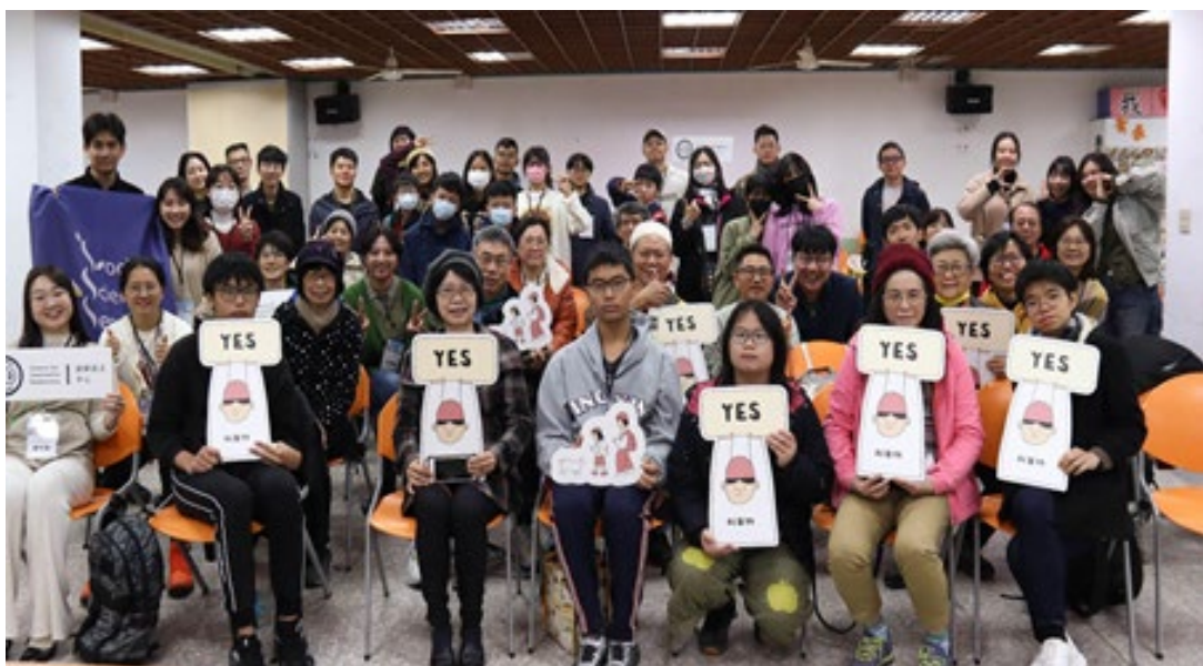
▶ 「文山區淨零公正轉型公共論壇」大合照