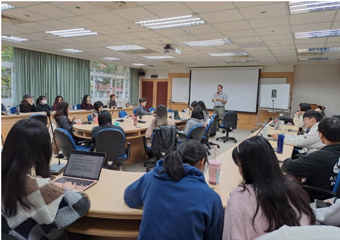
▶ 英國語文學系寫作與閱讀班學生以及眾位校內外師生與會眾多