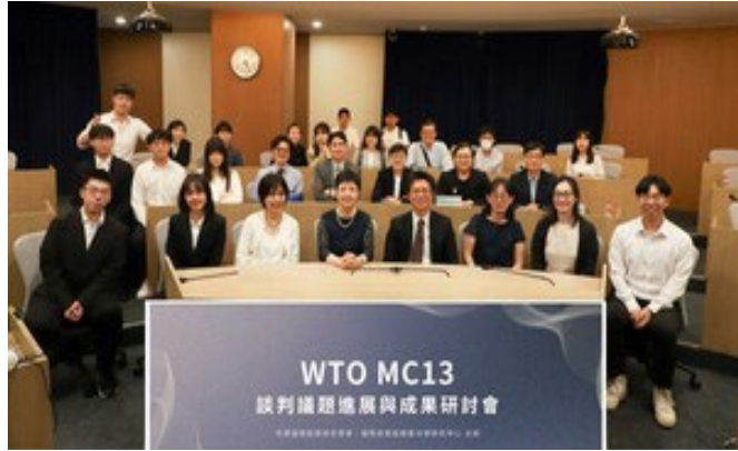
▶ 研討會全體大合照

•【國際經營與貿易學系訊】國際經營與貿易學系「國際經貿組織暨法律研究中心」聯合「中華國際經貿研究學會」於 3 月 25 日舉辦「WTO MC13 談判議題進展與成果研討會」。邀請國際經貿領域之國內外學者共聚一堂，討論甫於今（103）年 3 月初結束之 WTO 第 13 屆部長會議成果。