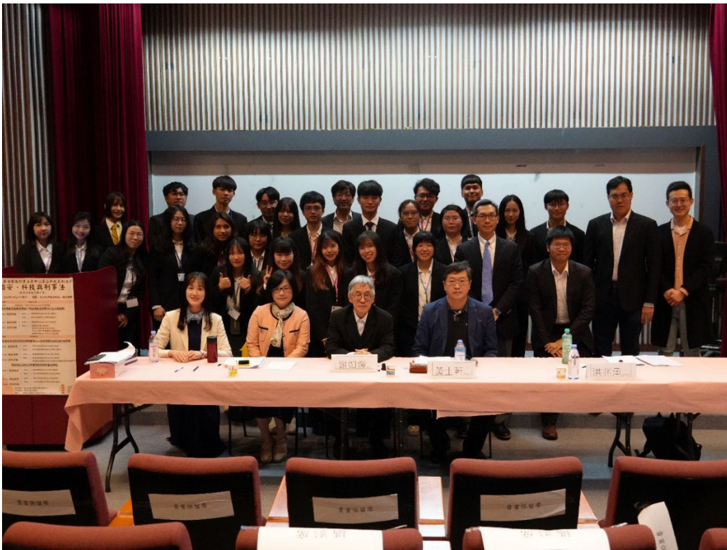
▶ 與會來賓全體合照