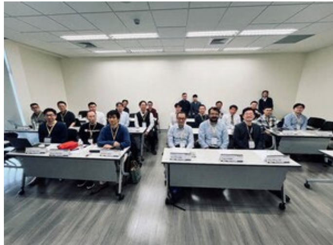
▶第一屆應用經濟國際論壇邀請澳洲、日本及臺灣學者齊聚一堂

•【應用經濟與社會發展英語碩士學位學程訊】社會科學學院應用經濟與社會發展英語碩士學位學程（IMES）於3月22日舉辦第一屆應用經濟國際論壇（International Symposium of Applied Economics）。論壇邀請澳洲國立大學、日本京都大學、日本大阪大學、日本立教大學、國立政治大學、國立臺灣大學及中央研究院從事應用經濟相關研究的學者齊聚一堂，聚焦於大數據、公共財政、勞動與產業等議題的討論。此次的應用經濟國際論壇與