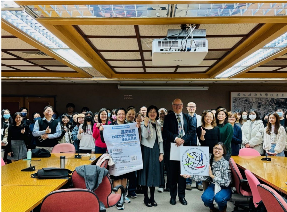
▶ 與會師生合影

●【外國語文學院訊】外國語文學院翻譯與跨文化研究中心於3月16日特別邀請現任臺灣現代詩人協會理事長、趙明河義士研究會金尚浩會長，擔任首場「翻譯大師講座」講者，為新學期揭開序幕。此次講座以「審美觀點和意識：臺灣文學韓譯狀況與傳介的影響」為題，介紹臺灣現代文學作品進入韓國學界的歷史脈絡，以及自身投入臺灣現代文學作品韓譯的心路歷程。