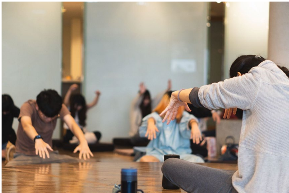
▶「綠色的三月」講座中，講師正示範瑜珈動作