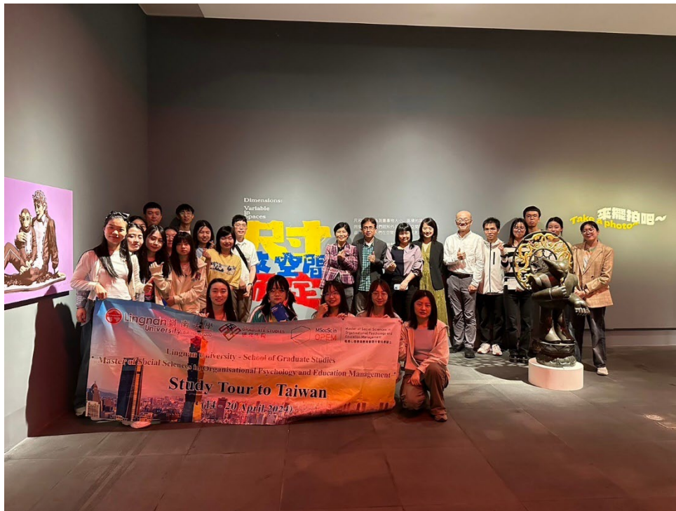
▶ 香港嶺南大學參訪團前往參訪國立台北藝術大學