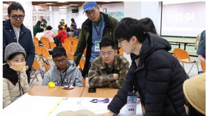
▶ 由永續創新民主研究中心成員帶領文山區跨世代參與者共同思辨與描繪文山藍圖