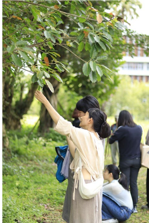
▶走讀工作坊中，講師帶領學生在達賢圖書館週邊尋找植物

每週五下午的「香氣煉金術」講座以木、火、土、金、水五大元素出發，對應到多種植物精油的介紹及運用，搭配繪圖、按摩、香氣拓包製作等活動。而週六整天的「自然療癒走讀」工作坊帶領學生在校園內尋找植物蹤跡、嗅聞自然的氣味，觀察外界也回看自己的身心。