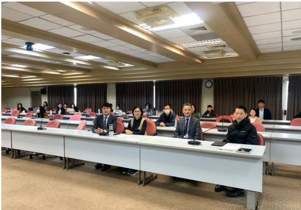
▶ 與會師生合照