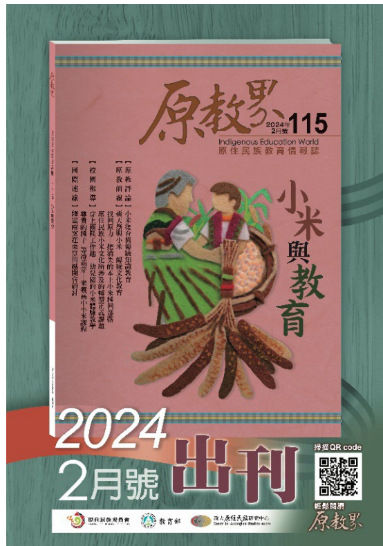
▶《原教界》115 期封面照