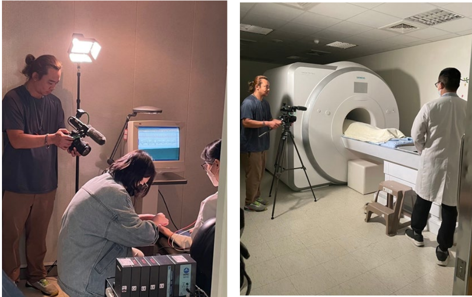
▶ 台視新聞「發現科學」採訪中心拍攝及採訪心智、大腦與學習研究中心 ( 照片來源：心智、大腦與學習研究中心 )