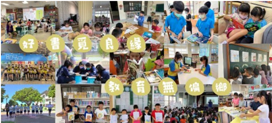
▶2024 「好書覓良緣·教育無偏鄉」即將在 5 月上線, 歡迎大家繼續給予滿滿的支持

每一本書不單單只是一本書, 「閱讀」也不只是帶著孩子看書就好, 而是需要師長們花費心力與時間去設計出有趣的閱讀活動, 持續不斷地讓孩子感受到這是一件有趣的事情、是讓自己有所收穫的, 開始願意主動打開一本書, 謝謝所有師長們的付出, 努力讓新奇的知識、溫暖的文字留在孩子心中很久很久。2023 「好書覓良緣·教育無偏鄉」感動分享： https://ruo.k12ea.gov.tw/blog/122/