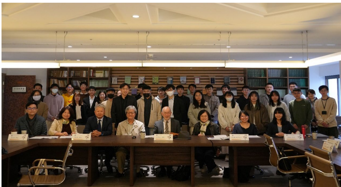
▶ 法學院與會師生中場休息前合影留念