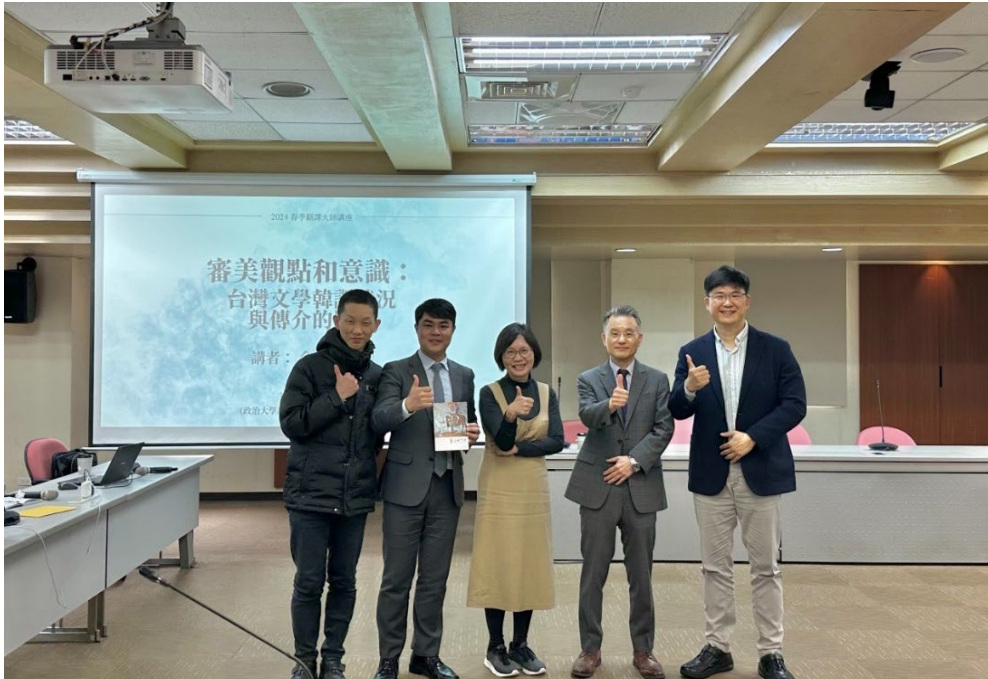
▶ 外國語文學院招靜琪副院長（中）、翻譯與跨文化中心林侑毅主任（左二）、韓國語文學系朴炳善主任（右一）及阿拉伯語文學系鍾念零助理教授（左一）聯袂歡迎臺灣現代詩人協會金尚浩理事長（右二）蒞校演講

的關係，才能在翻譯時如聞其聲，如見其人，更完整地將作者介紹給韓國讀者。金尚浩同時也特別感謝作家陳千武，他在 1996 年出版首部翻譯作品《開了木瓜花：陳千武詩選》，過程中有許多翻譯技巧，直接受教於原作者陳千武。金尚浩會長於 2023 年當選臺灣現代詩人協會理事長後，規劃於今（2024）年設立陳千武文學獎，以表彰其在臺灣現代詩與創作方面的貢獻。