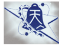
圖 1 國立彰化師範大學工教系系徽

標題超過一行，則與標題第一行第一個字上下切齊，圖內之字體大小可依實際需要設定，但整體應以清晰可讀為基本原則，如圖 1 所示。