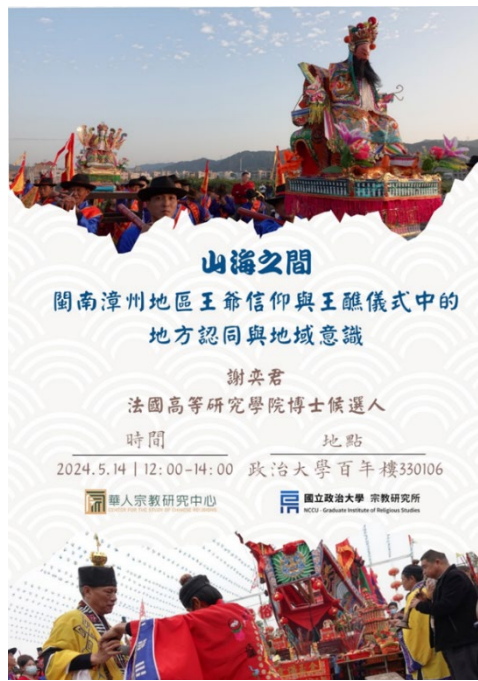
▸「山海之間：閩南漳州地區王爺信仰與王醮儀式中的地方認同與地域意識」