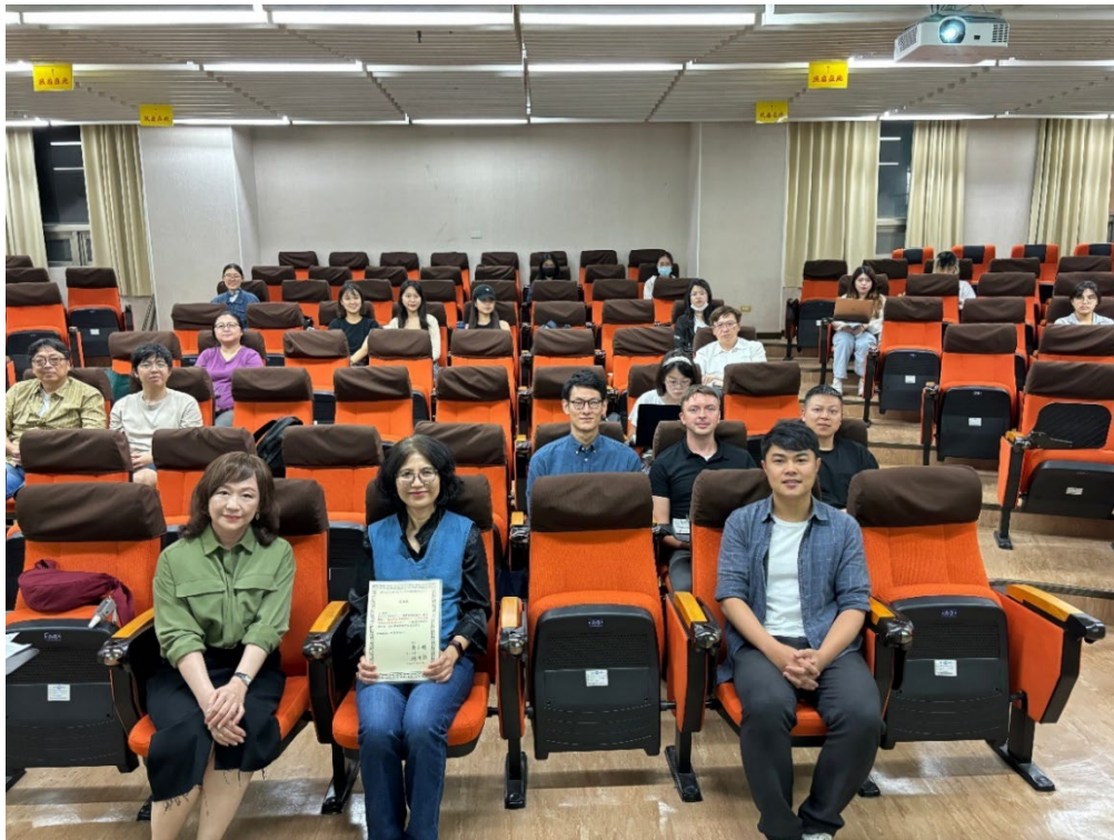
▶ 與會師生合影