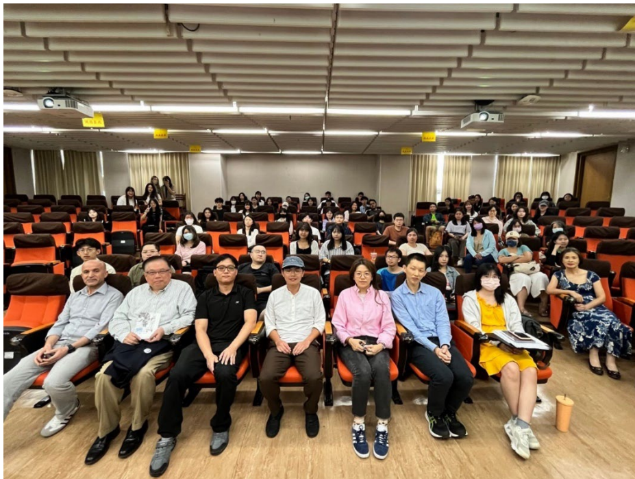
▶ 與會師生合影