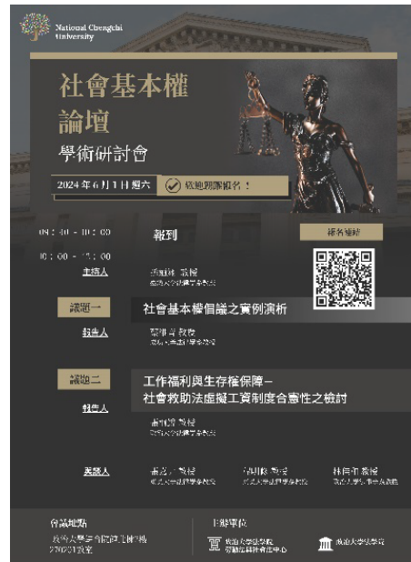
•活動海報

•【法學院訊】法學院勞動法與社會法中心於 6 月 1 日舉辦社會基本權論壇學術研討會，議題一為「社會基本權倡議之實例演析」，由國立成功大學法律學系蔡維音教授報告，議題二：「工作福利與生存權保障—社會救助法虛擬工資制度合憲性之檢討」，由法學院張桐銳教授報告，並邀請東吳大學法律學系張嘉尹教授、程明修教授及國立政治大學法學院林佳和教授與談，由國立臺灣大學法律學系孫迺翊教授主持。