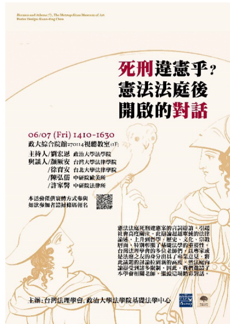
▶「死刑違憲乎？憲法法庭後開啟的對話」活動海報

•【法學院訊】憲法法庭死刑違憲案的言詞辯論，引起社會高度的關注。此辯論超越單純的法律論述，上升到哲學、歷史、文化、宗教層面，特別彰顯了基礎法學的重要性。臺灣法理學會的多位老師們，以專家或是法庭之友的身分出具了專業意見，將此議題的討論拉到新的高度，然法庭內論辯受到諸多限制，因此，法學院基礎法學中心於 6 月 7 日邀請學會相關老師，辦理「死刑違憲乎？憲法法庭後開啟的對話」演講，繼續這場精彩的對話。活動由法學院劉宏恩教授主持，由國立臺灣大學法律學院顏厥安特聘教授、國立臺北大學法律學院徐育安教授、中央研究院歐美研究所陳弘儒助研究員及中央研究院法律學研究所許家馨研究員進行與談。