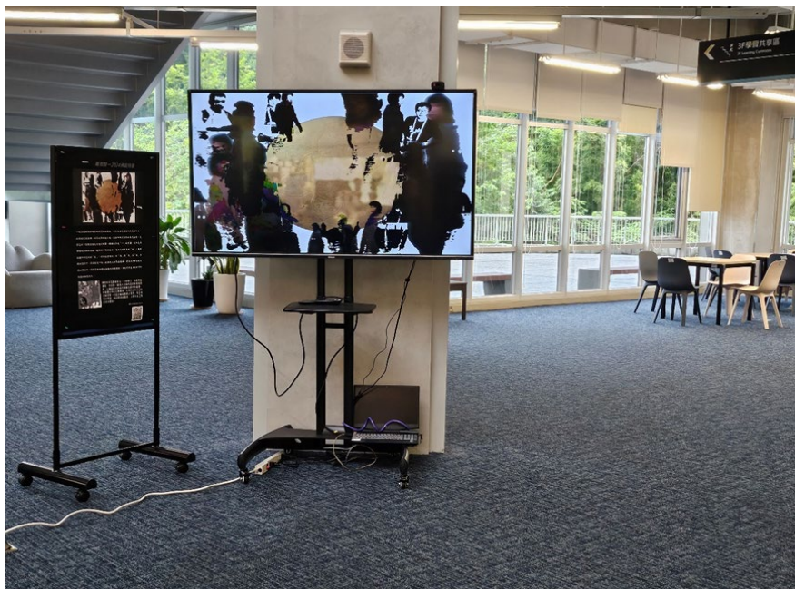
▶作品「一 (The One)」於達賢圖書館展出萬相歸一 2024 佛誕特展

此次展演為佛誕節期間，佛光山僧團參與鐵觀音節期間至達賢圖書館參觀；亦適逢復校 70 週年慶祝活動，達賢圖書館對外開放民眾參觀，於展演期間共吸引 6,000 多位校內師生及民眾參與作品互動。