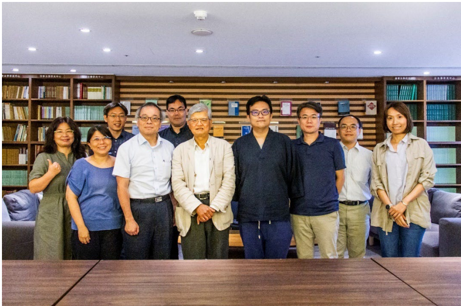
▶ 與會嘉賓合照

最後，黃源盛特聘教授談「人生」的學問。關於「人生是人運命，抑或命運人？」的大哉問，他以莊子「知其不可奈何而安之若命，德之至也。」的思想，闡明修養的極致，在於對無可奈何之事，安然、甘願地放下。他認為，「命」以性格、業力與因緣為主軸，轉動我們的人生。「性格決定命運，業力牽動命運，因緣有其複雜性，因此要隨緣。」他期勉在座師生：「生命自有緣起緣滅，面對命運，應轉『識』為『智』，做自己的主人。」為講座畫下圓滿的休止符。(撰文：李元熙)