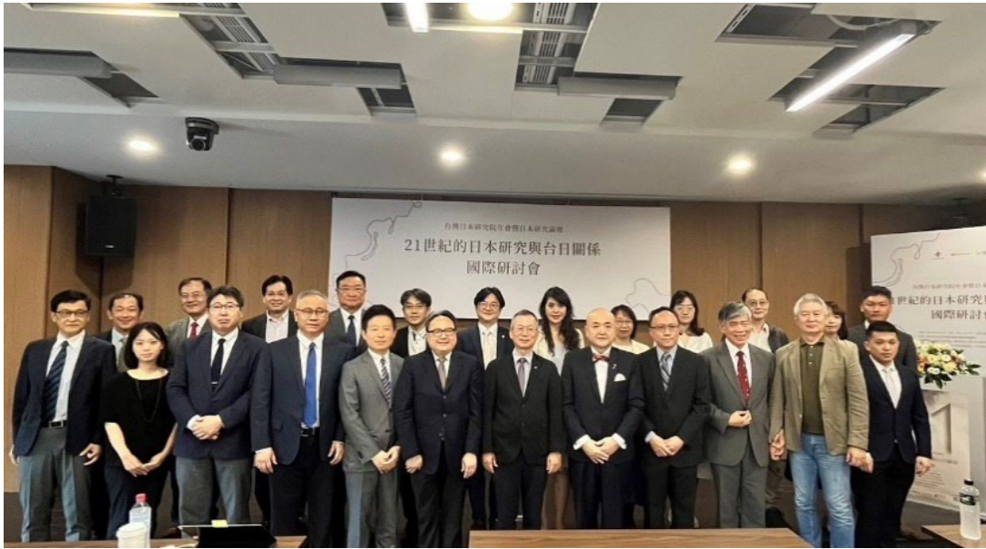
▶與會致詞貴賓與發表者合影

與會學者認為，在臺日關係的變化趨勢下，臺灣的日本研究不僅有學術價值，也有實務需求。他們將透過各種學術及實務平臺，持續推動臺灣的日本研究，為臺日關係建立更穩固的基礎。