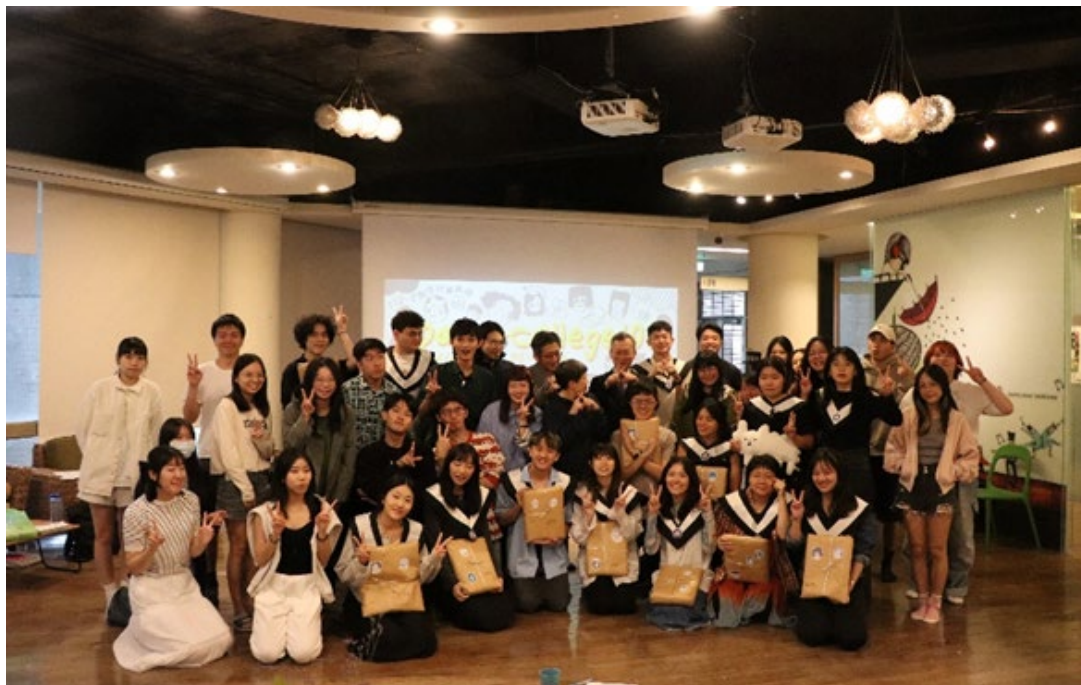
▶ 創意實驗室 112-2 結業典禮大合照