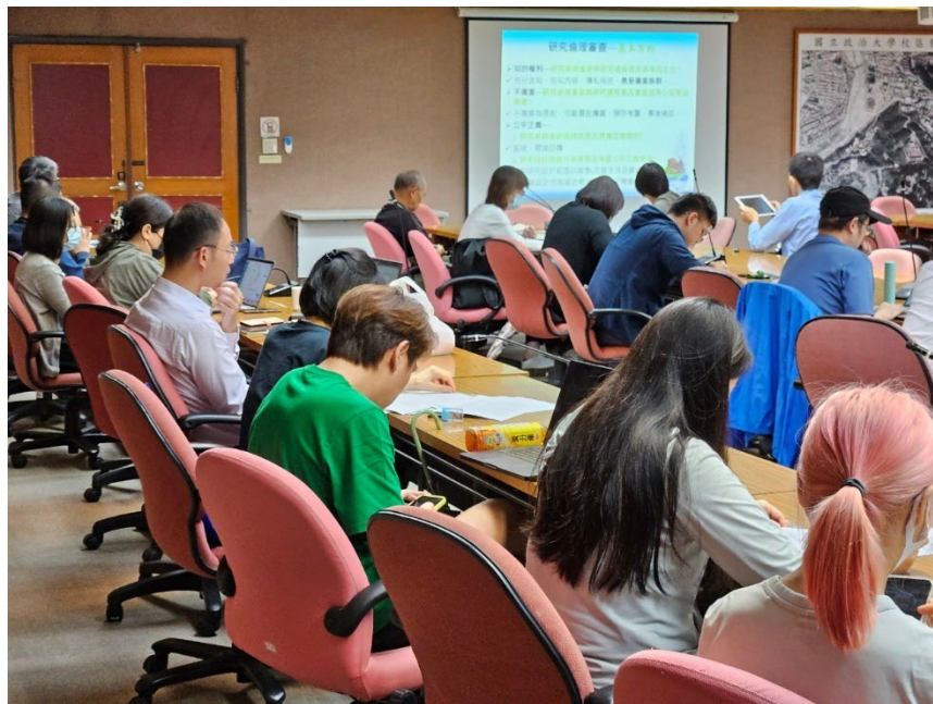
▶ 研究倫理教育訓練參與學員眾多