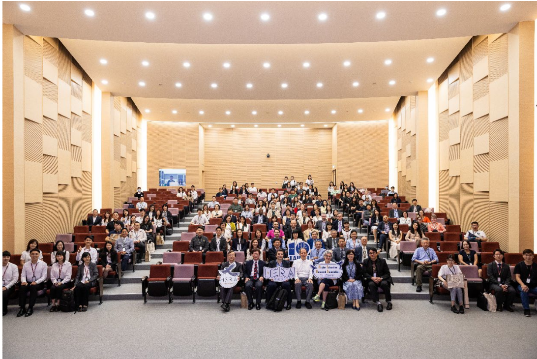
HERA 研討會大合照