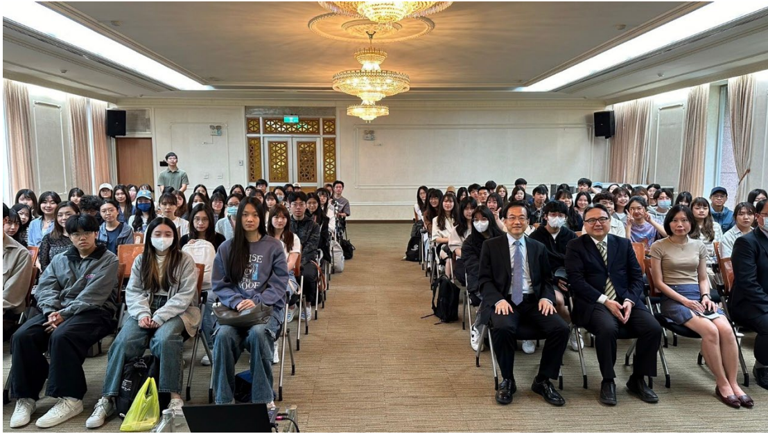
▶國合會師長與國立政治大學師生合影留念

●【國際事務學院訊】「教育部大專校院全民國防教育資源中心」（以下簡稱為「中心」）於5月16日舉行「2024全民國防教育暨防衛動員學術研討會」暨中心揭牌儀式，現場邀請教育部林騰蛟次長、國防部副柏鴻輝部長、國立政治大學李蔡彥校長、教育部學特司吳林輝司長、國防部全動署白捷隆署長、國防部政戰局文宣處樓偉傑處長、國立政治大學詹志禹副校長、國際事務學院連弘宜院長共同揭牌，以及多位公部門及學界貴賓共同見證。