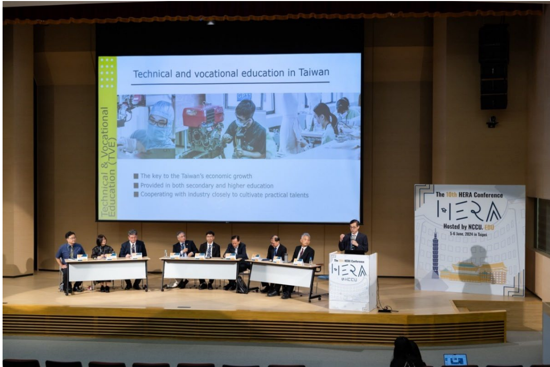
▶此次高等教育研討會在教育部支持下，邀請全臺共八所科大之校長、副校長代表進行產學合作、大學社會責任之分享，並由考試院姚立德委員（右一）主持