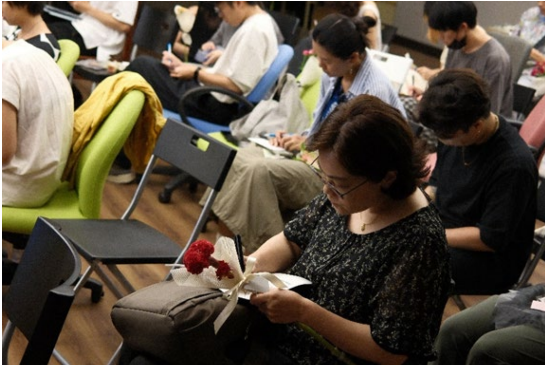
▶ 創意實驗室期末展「普通生活學 101 days」活動側拍