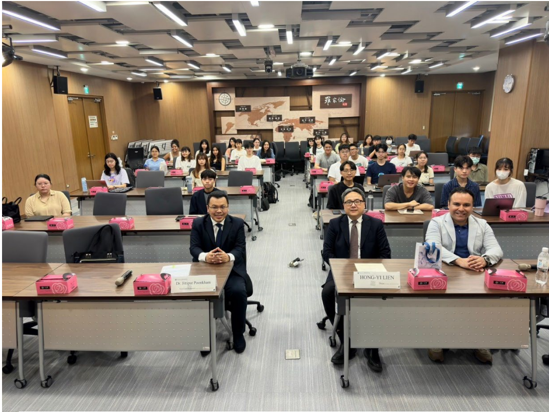
▶與會代表與參與者大合照