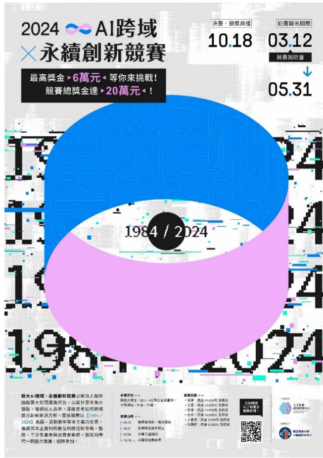
▶2024 AI 跨域永續創新競賽活動海報