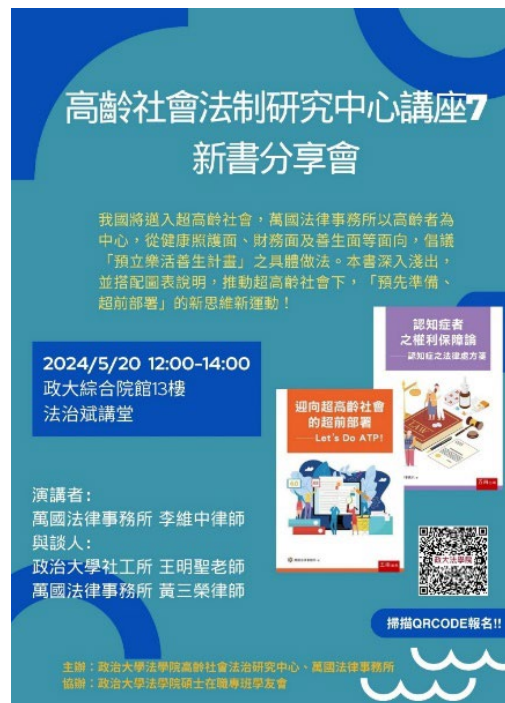
▶ 「高齡社會法治研究中心講座 7: 新書分享」演講海報

•【法學院訊】法學院高齡社會法制研究中心於5月20日邀請萬國法律事務所李維中律師演講，主題為「高齡社會法治研究中心講座 7: 新書分享」，邀請社會工作研究所王明聖副教授、萬國法律事務所黃三榮律師與談。我國將邁入超高齡社會，萬國法律事務所以高齡者為中心，從健康照護面、財務面及善生面等面向，倡議「預立樂活善生計畫」之具體做法。